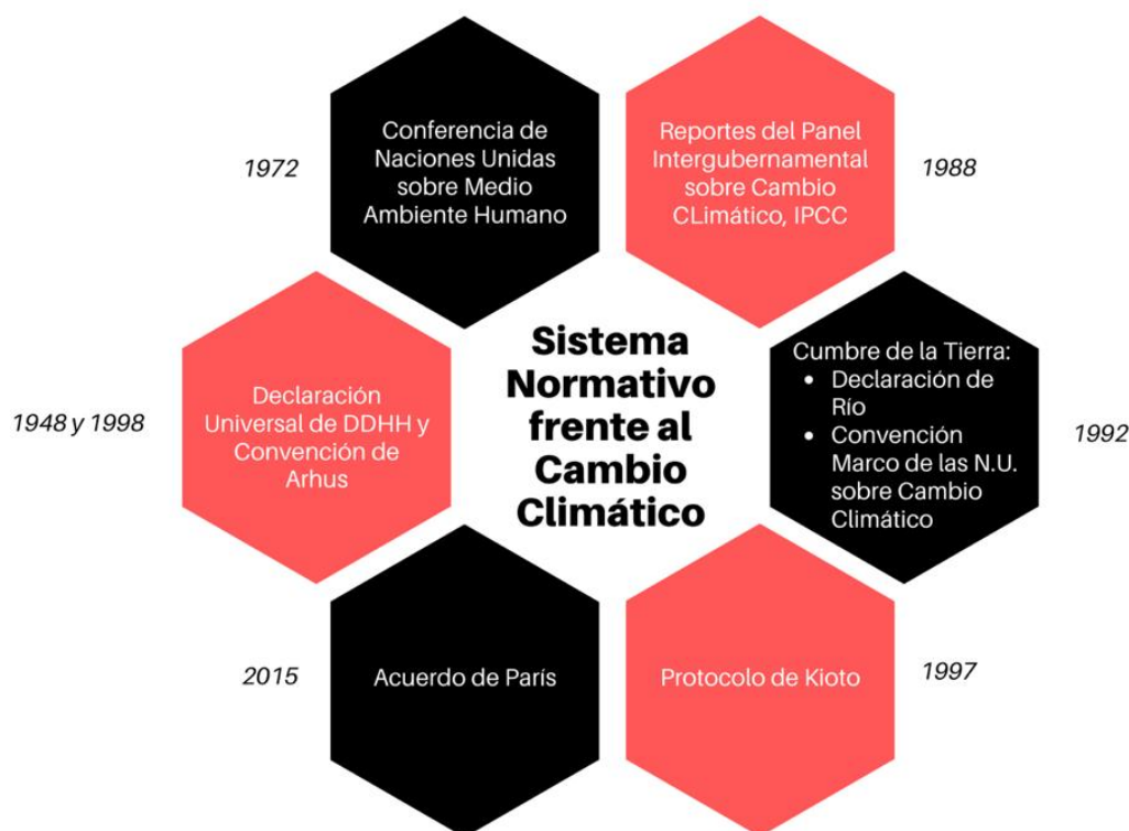
GRÁFICO 3. INSTRUMENTOS INTERNACIONALES