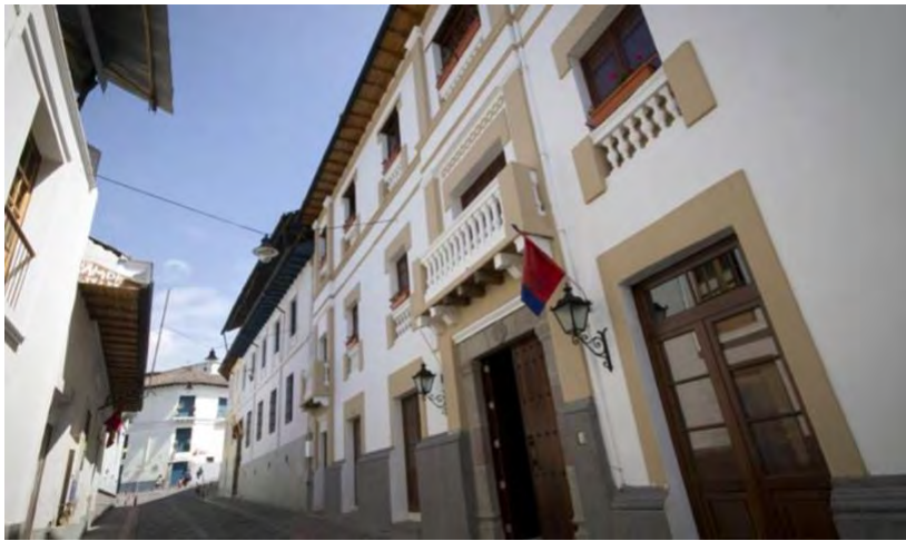
Figura 14. Hotel exterior

El hotel Casona de la Ronda ubicado en el centro histórico es un hotel boutique colonial en donde predominan los colores cálidos y maderosos. El exterior del hotel es la famosa calle La Ronda donde predomina el blanco, la calle de bloques y casas coloniales. Por otro lado en los interiores el color amarillo de sus luces dan una sensación de acogimiento, serenidad y paz.