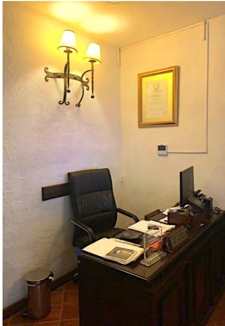
Figura 16. Recepción

La recepción o front desk es donde Diego y los demás recepcionistas trabajan durante 8 horas diarias. Aquí es el lugar donde reciben a los huéspedes y donde los despiden. Es el primer lugar que los huéspedes conocen y donde pueden acercarse para cualquier duda o requerimiento.