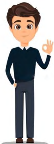
Figura 9. Personaje Diego