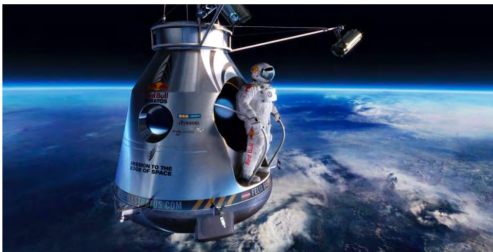
Figura 6. Salto de F. Baumgartner

Uno de los pilares fundamentales para crear este reconocimiento, ha sido el uso del Branded Content , pues no utiliza su producto como principal motivador para el consumo, sino que son sus valores, su personalidad y sus eventos, lo que le permiten crear contenido fresco, arriesgado y lleno de adrenalina, donde se ha dejado de lado a la bebida energética y los protagonistas han sido personas admirables.