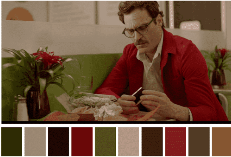
Figura 13. Paleta colores fríos