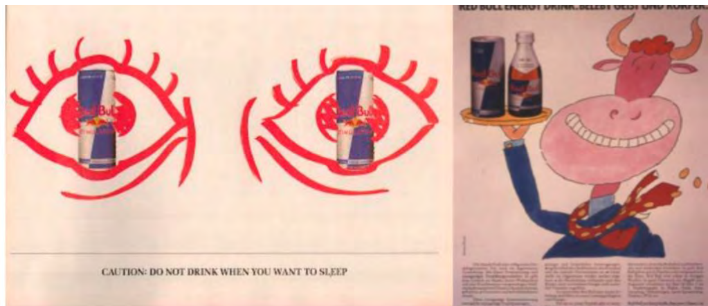
Figura 3. Inicios de Red Bull