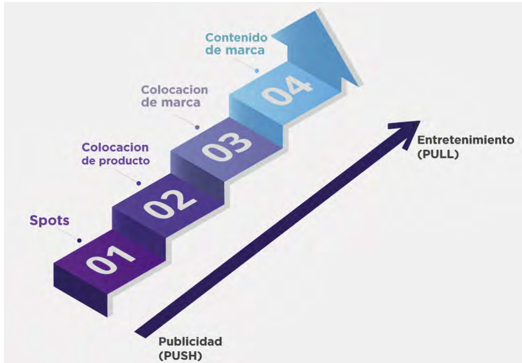
Figura 1. Metodología Push y Pull

o servicio, sino más bien a intentar que el cliente dedique la mayor cantidad de tiempo a conocer no solo sobre el producto, sino sobre la marca.