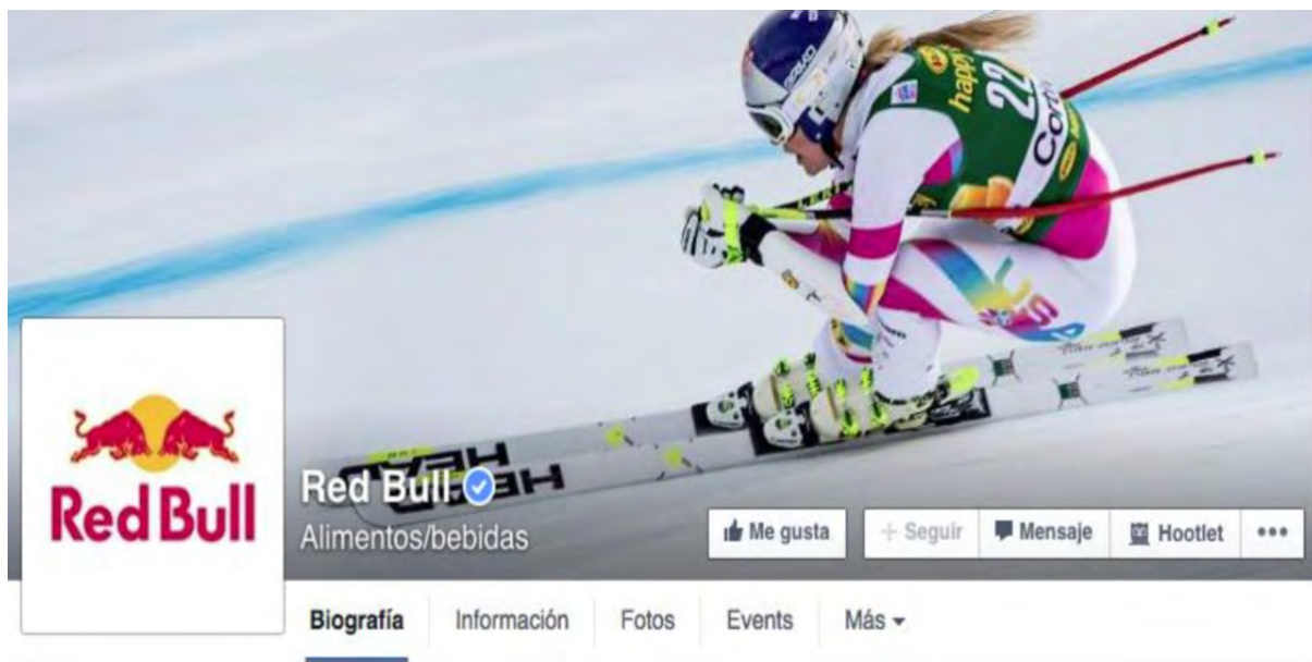
Figura 5. Facebook de Red Bull

post y un promedio de 1M de views en sus videos. En su cuenta de YouTube posee diferentes canales para sus eventos como Red Bull Batalla que cuenta con 6.19M de suscriptores y en su canal oficial cuenta con 10M de suscriptores. Esto evidencia el engagement que ha conseguido la marca al involucrarse en diferentes campos del entretenimiento y deportes extremos, atrayendo a públicos más amplios y diversos a consumir sus productos y eventos.