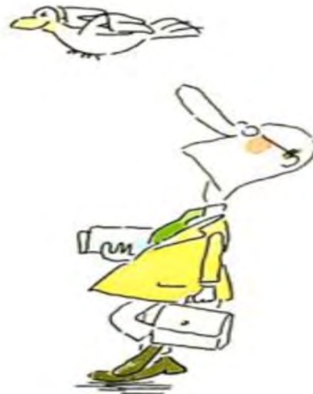
Figura 4. Primer "Pigeon Ad"

En el 2002, la marca llegó a los Estados Unidos y empezó su competencia con la bebida Monster. En este campo, Red Bull utilizó promotoras que llevaban el producto a los campus universitarios y eventos deportivos.