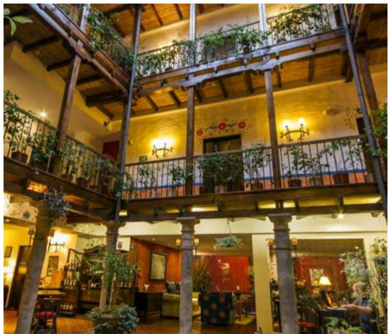
Figura 15. Hotel interior