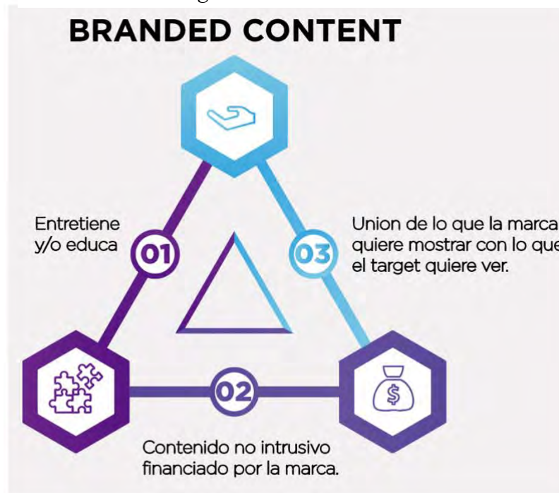
Figura 2. Branded Content

Al hablar de un producto Branded Content , no se habla de una pieza común publicitaria, sino de una publicidad comunicacional alojada en escenarios culturales y tecnológicos.