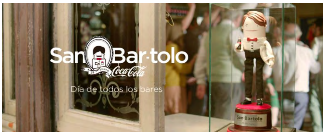
Figura 7. Día de todos los bares (29 de junio)

Para mantener la interacción con la audiencia, se creó buzz en redes y transmitieron gratuitamente sus eventos en calidad HD. Motivaron a su público a que compartieran sus experiencias en tiempo real y se encargaron de presentar, a un lado de la presentación en vivo, este contenido. La campaña superó las expectativas, llegando a un total de 2M de visitas y 1M de visitantes únicos (IBA México).