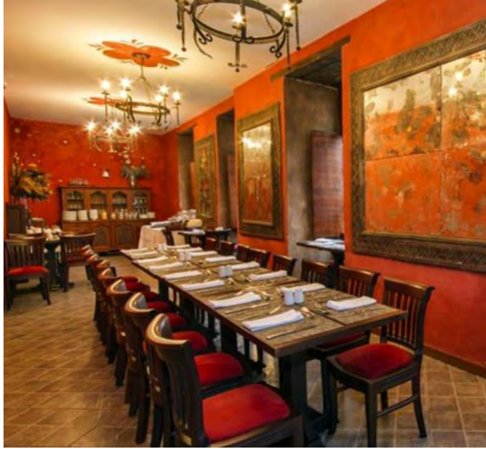
Figura 18. Restaurante

El lugar donde Richard y Lilian desayunan todos los días y donde sucede una de las escenas finales.