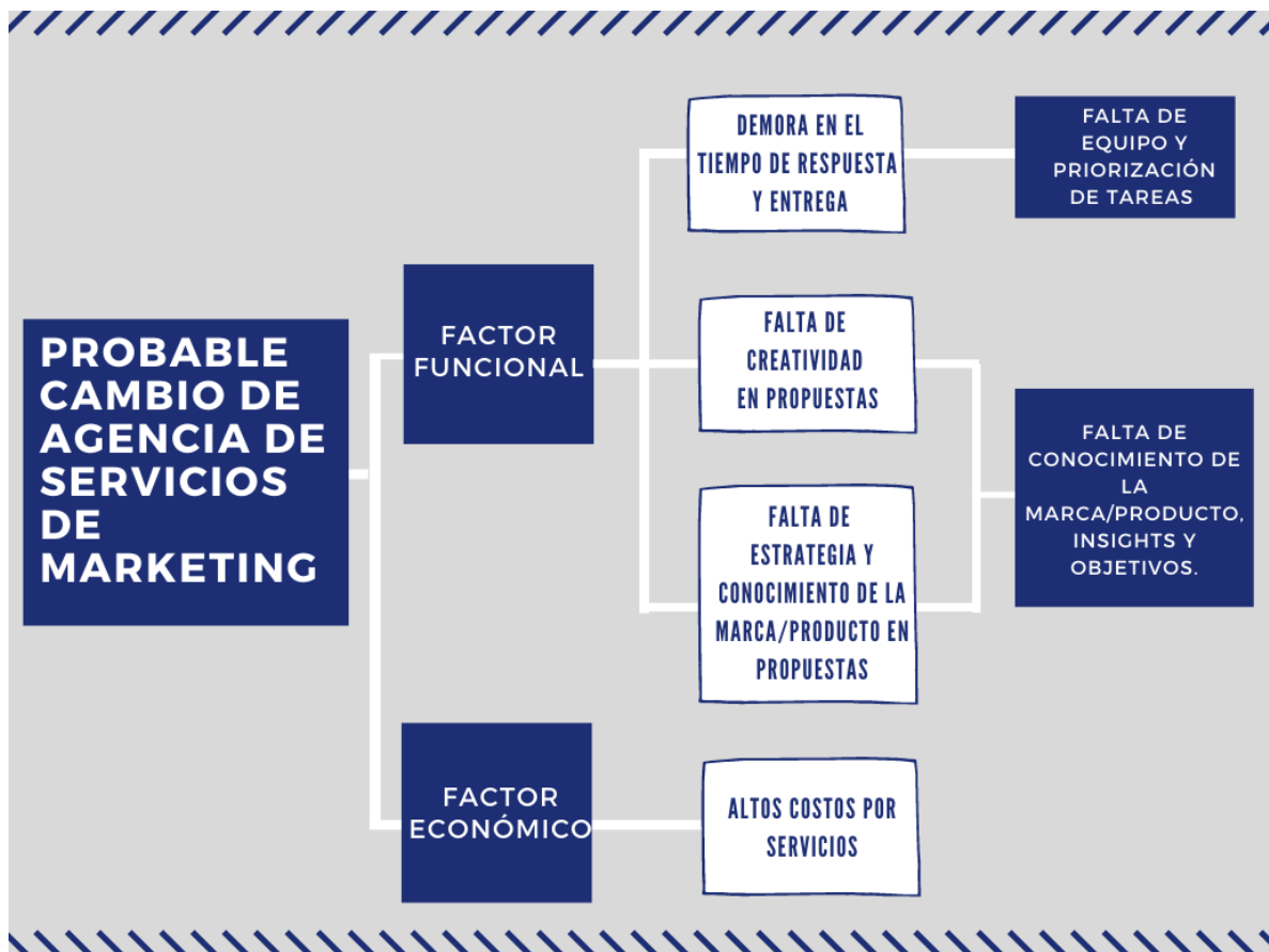
Figura 5. Árbol de diagnóstico. Salas, R.