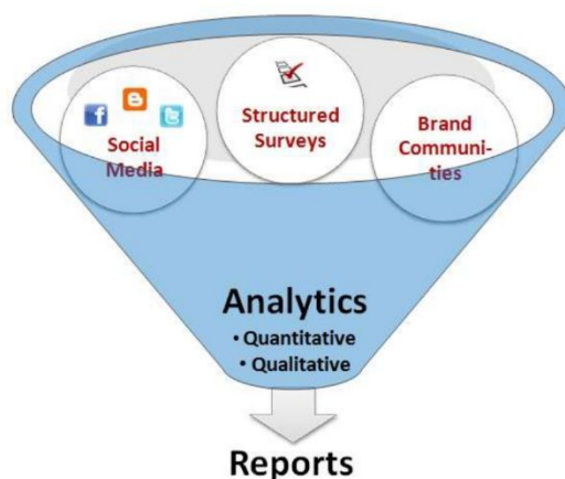
Figura 1. Fuentes de recolección de datos para medir el Customer Experience. Adaptado de: TCE Total Customer Experience Building Business through Customer-Centric Measurement and Analytics (p. 124), por Hayes, B. (2013).

Estas fuentes permitirán la medición de los algunos insights que el consumidor o cliente tenga hacia la marca o empresa, entre estos: lealtad, satisfacción, experiencia y sentimientos.