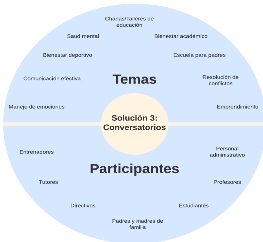
Figura 6: Solución 3 - Conversatorios para todos los miembros de la comunidad Independiente del Valle.