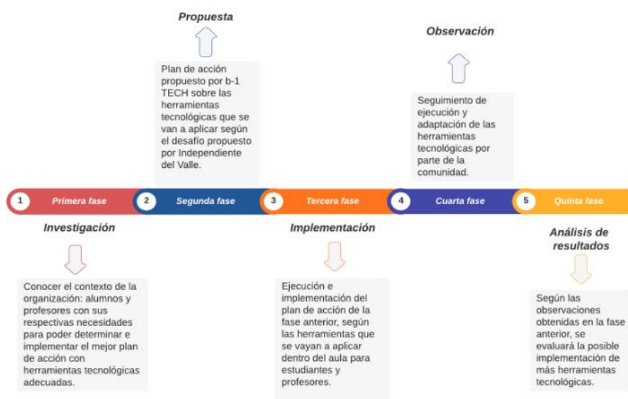
Figura 5: Solución 2 - Herramientas tecnológicas b-1 TECH.

necesidades de conectividad de la institución. Esta fase de investigación es importante para poder desarrollar un plan de implementación de tecnología con herramientas educativas innovadoras. A continuación, seguirá la fase 2 en la cual se desarrollará una propuesta tomando en cuenta la fase de investigación, la cual responderá al contexto y a las necesidades específicas del colegio para luego pasar a la fase 3 de implementación y finalmente la fase 4 de análisis y evaluación del proyecto.