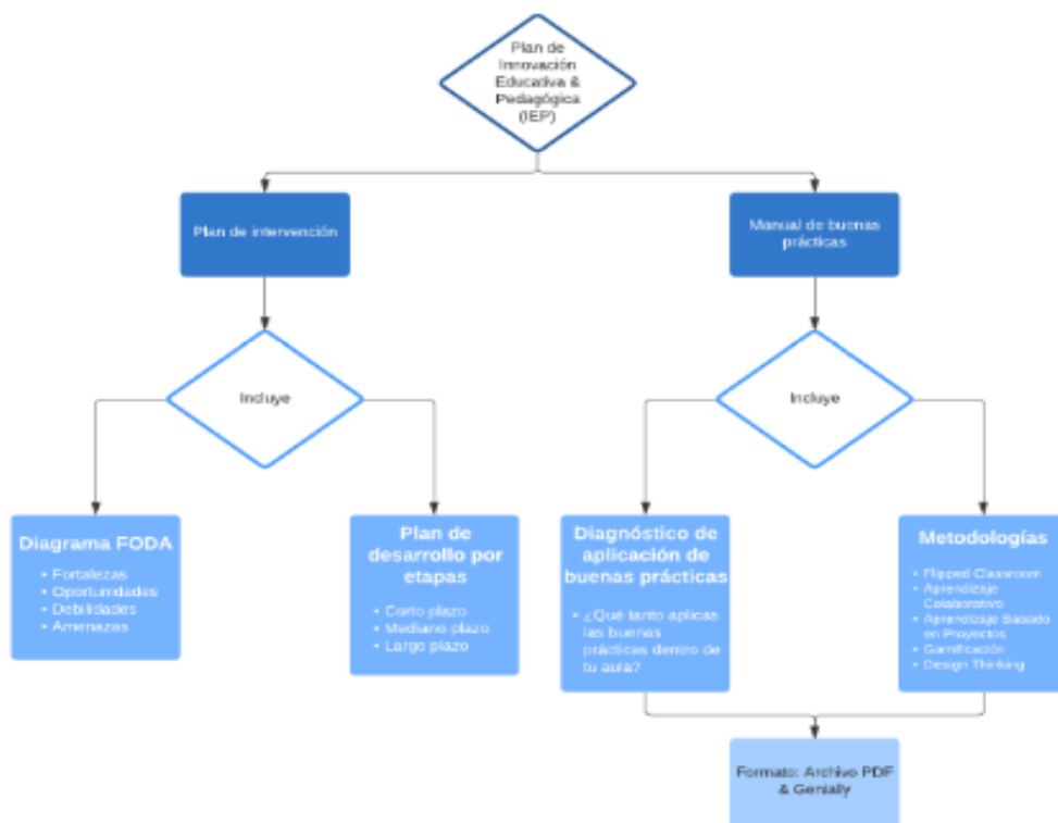
Figura 4: Solución 1 - Plan de Innovación Educativa IPE.

Dentro del manual encontrarán 5 metodologías de la enseñanza y estas son: Flipped Classroom, Aprendizaje Basado en Proyectos (ABP), Aprendizaje Cooperativo, Gamificación y Design Thinking. En cada metodología se detalla su concepto, ventajas de su aplicación y posibles retos que se pueden presentar, para que los profesores tengan una visión de cómo manejarlos y también encontrarán un video interactivo sobre cada metodología. Este manual lo podrán encontrar en dos versiones: la primera en un documento PDF y la segunda en un Genially elaborado por nosotras.