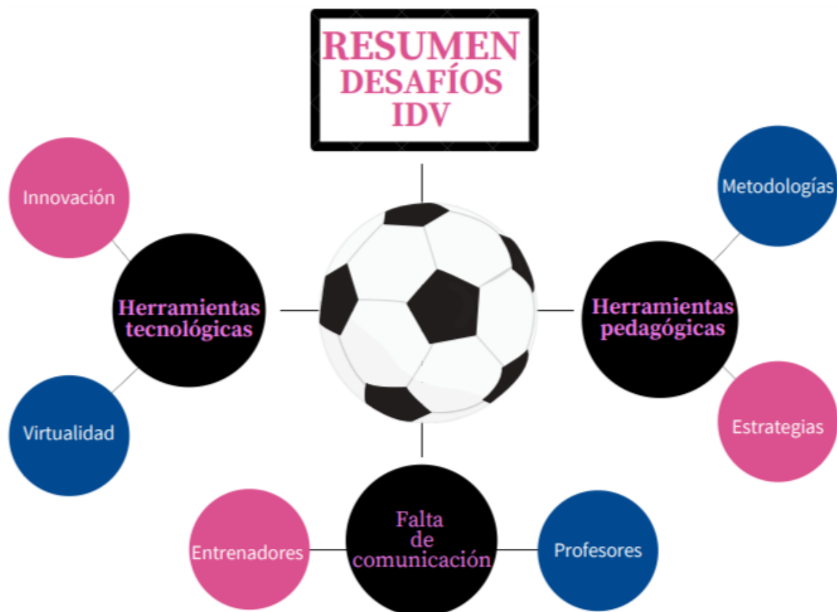
Figura 3: Resumen sobre los desafíos Independiente del Valle.

primera solución está enfocada en proveer una variedad de metodologías de enseñanza a los docentes. La segunda solución está enfocada en fortalecer el conocimiento de las herramientas tecnológicas; y la última solución se enfoca en un conjunto de conversatorios junto con toda la comunidad del Independiente del Valle: profesores, estudiantes, entrenadores, tutores, padres de familia y personal administrativo.