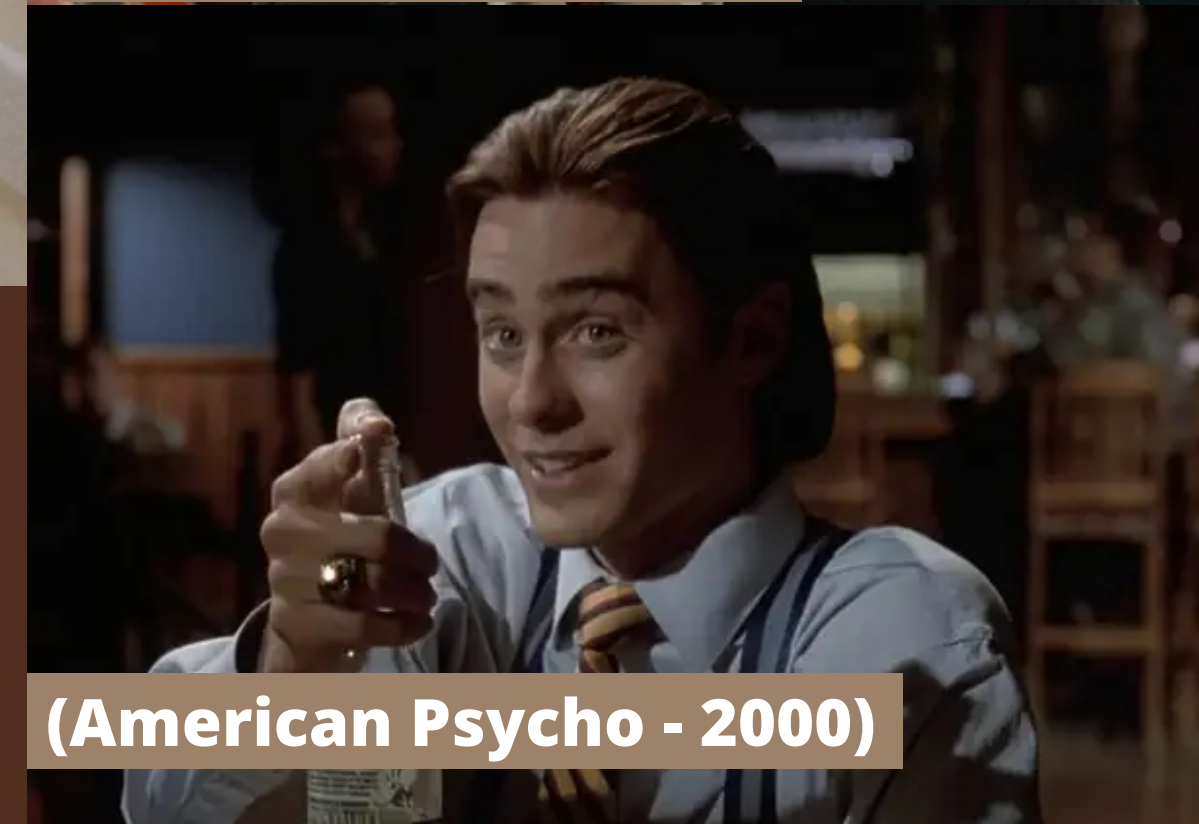
(American Psycho - 2000)