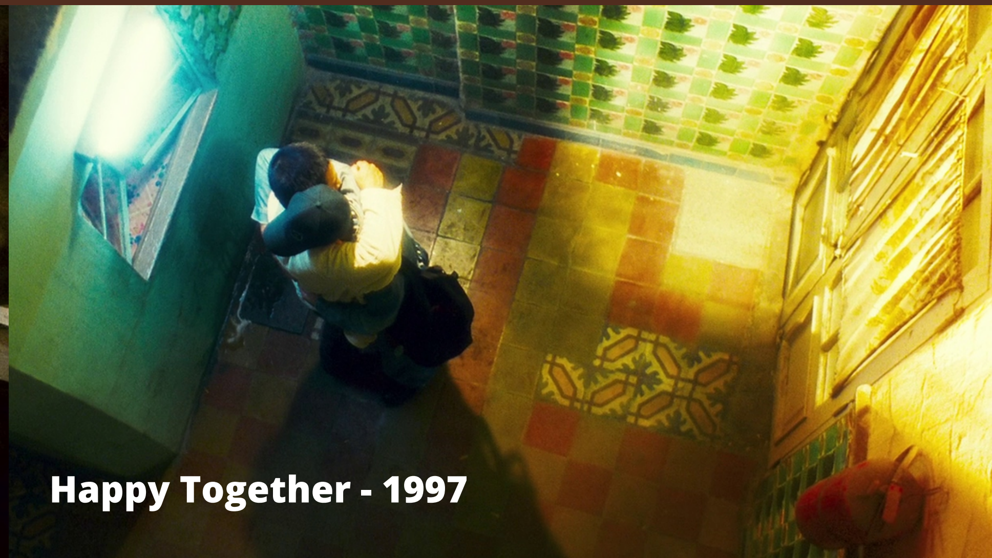
Happy Together - 1997