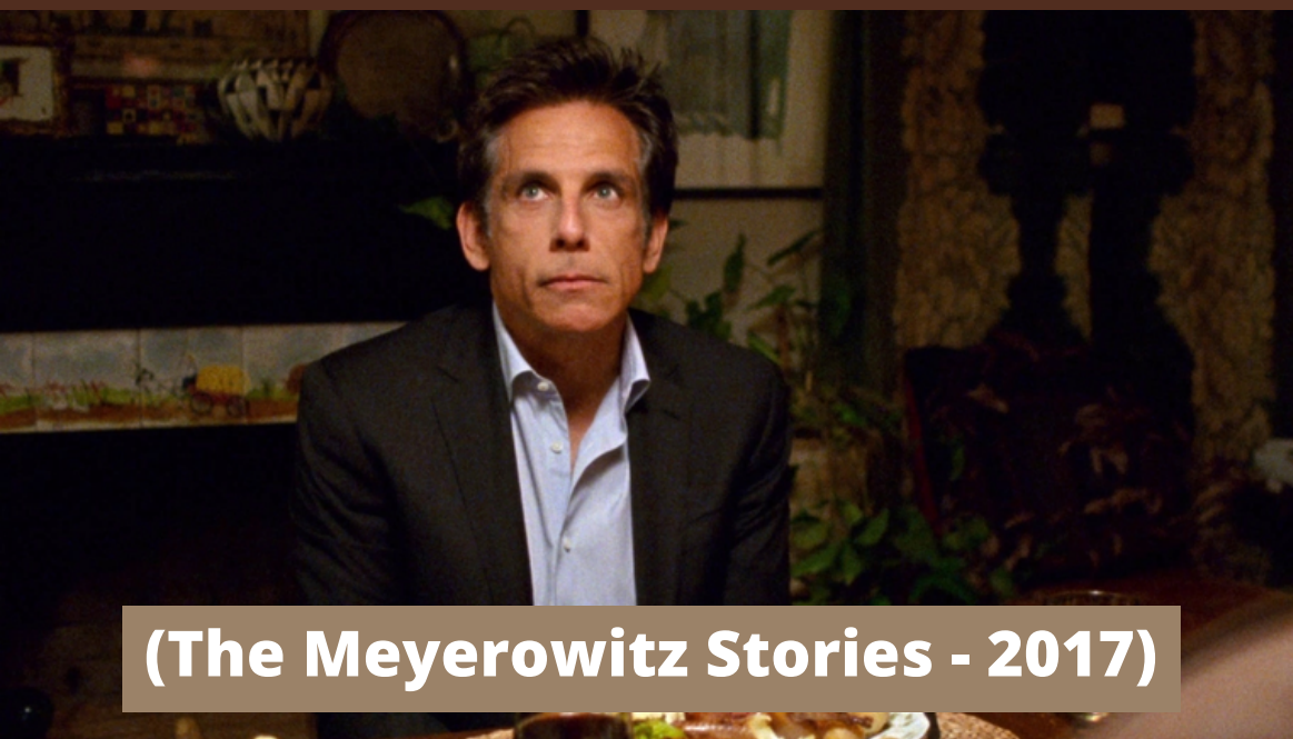
(The Meyerowitz Stories - 2017)