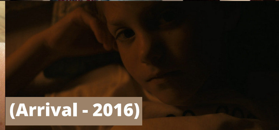
(Arrival - 2016)