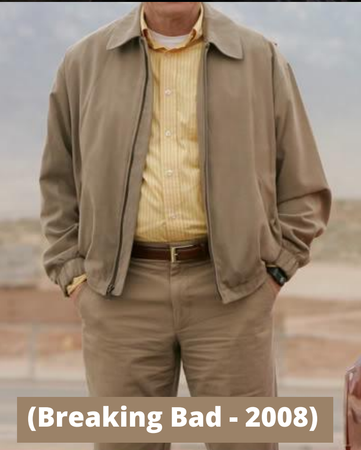
(Breaking Bad - 2008)