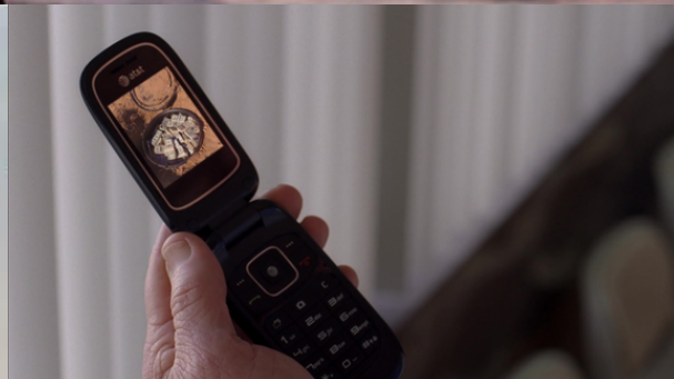
(Drifting Clouds - 1996)