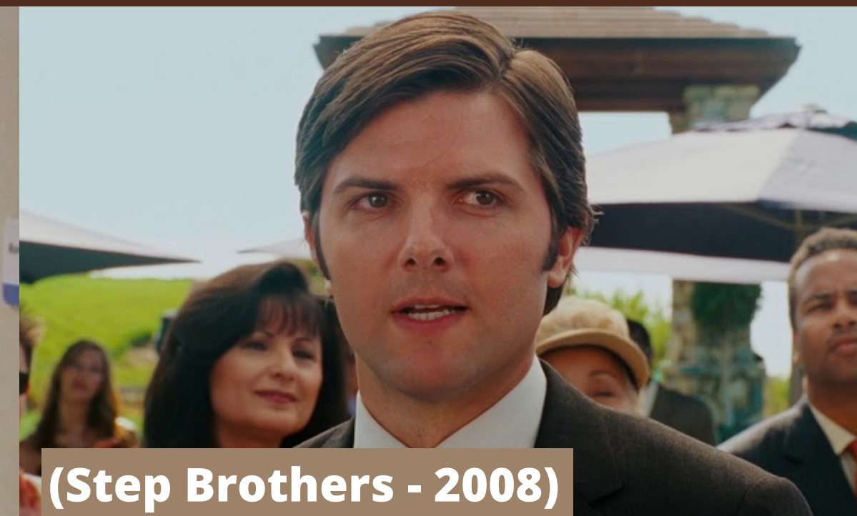
(Step Brothers - 2008)