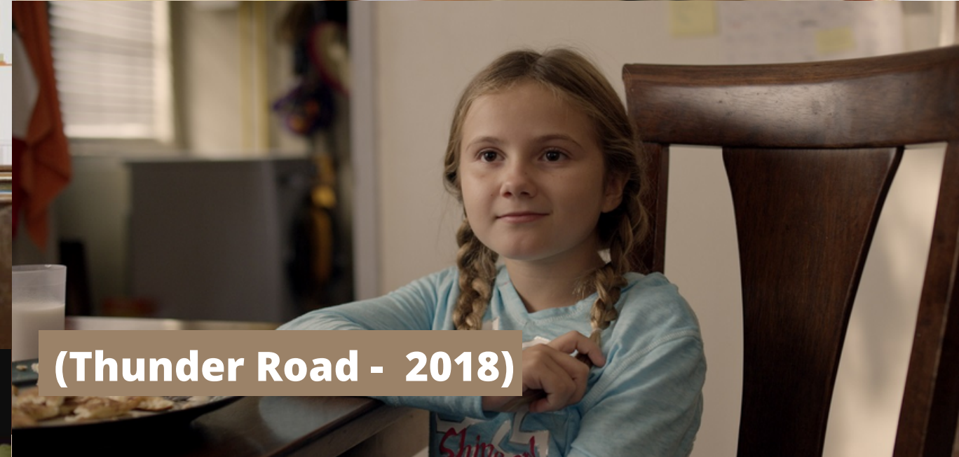
(Thunder Road - 2018)