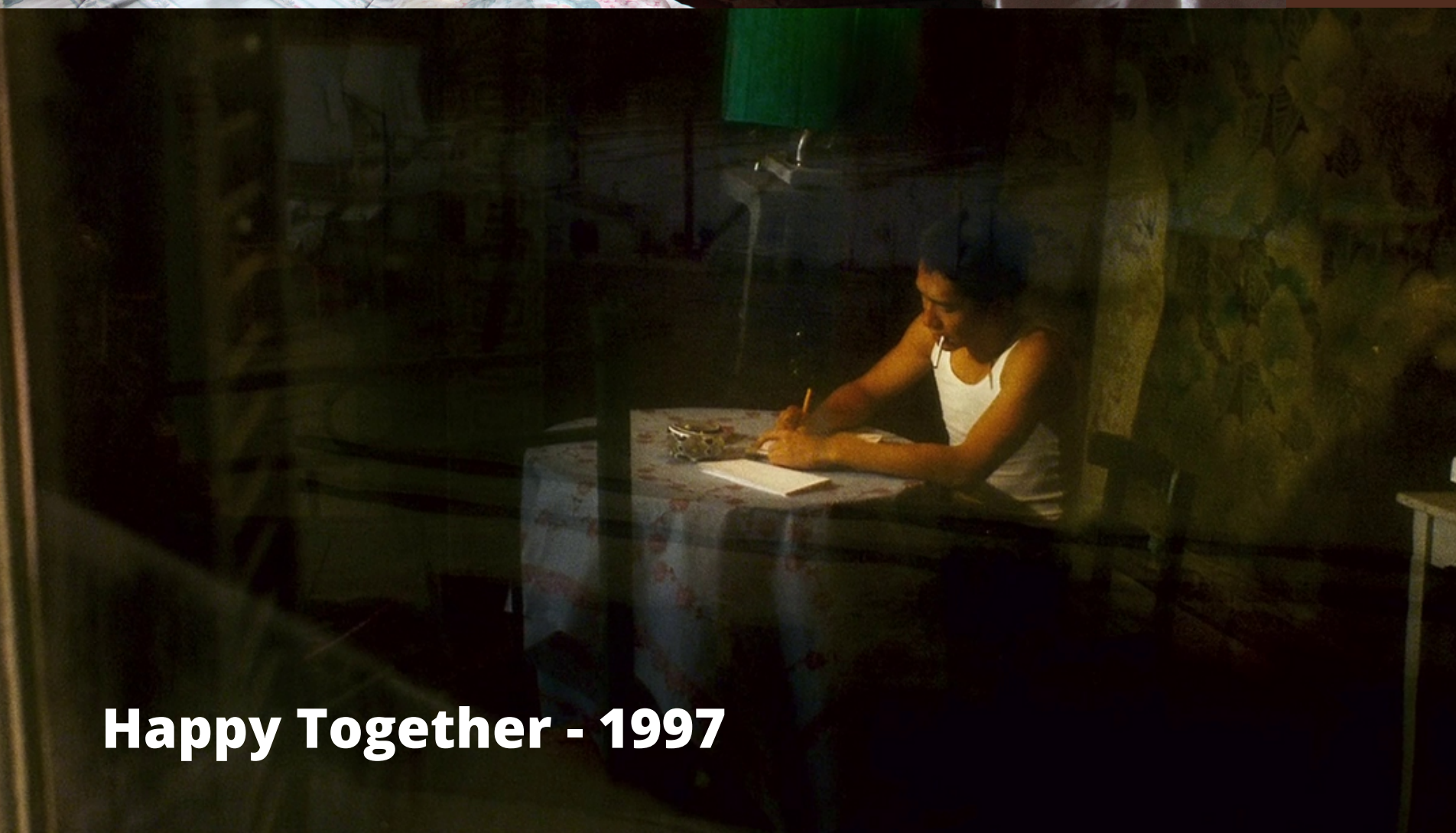
Happy Together - 1997

Lleno de antigüedades con arquitectura anticuada. Resaltar el abandono y el deterioro de la locación.