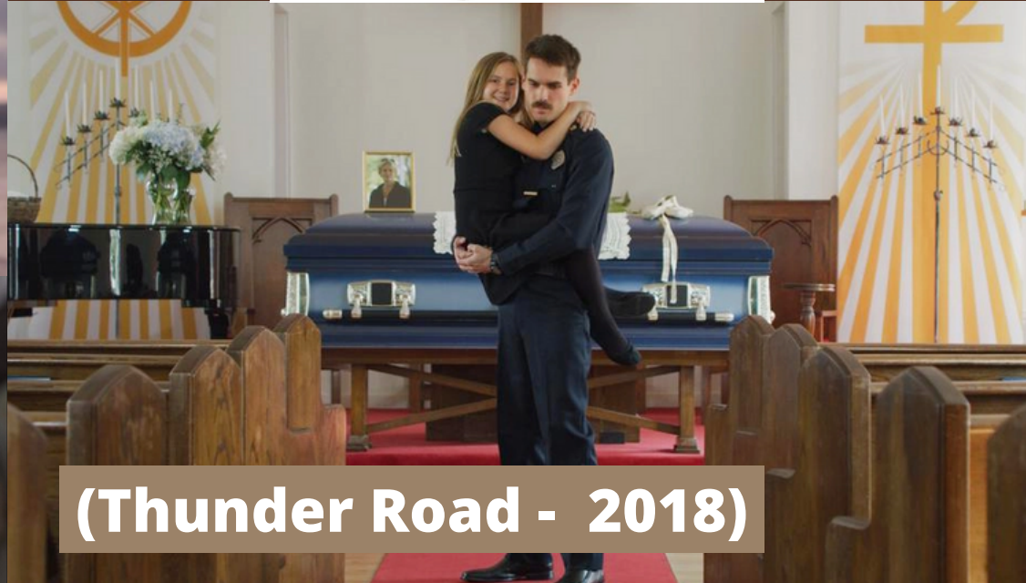
(Thunder Road - 2018)