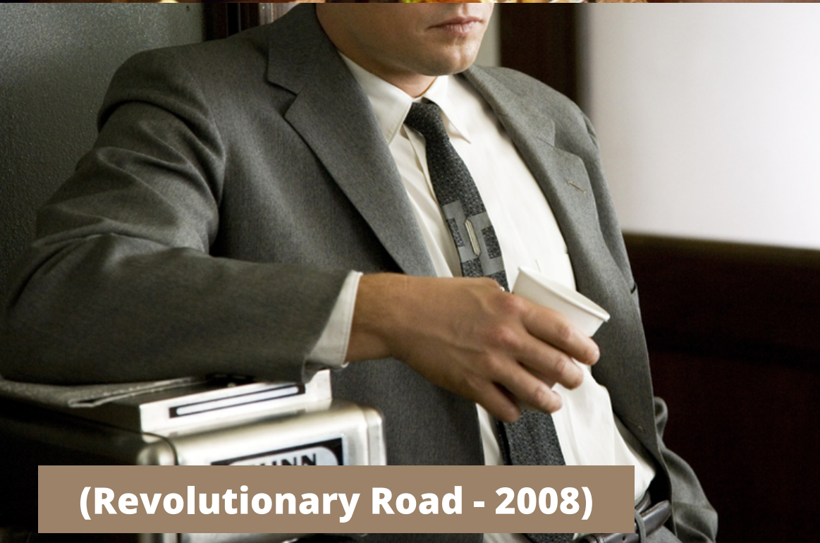
(Revolutionary Road - 2008)