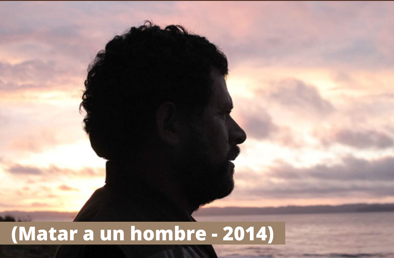
(Matar a un hombre - 2014)