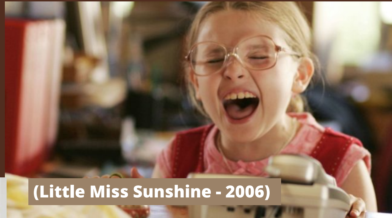
(Little Miss Sunshine - 2006)