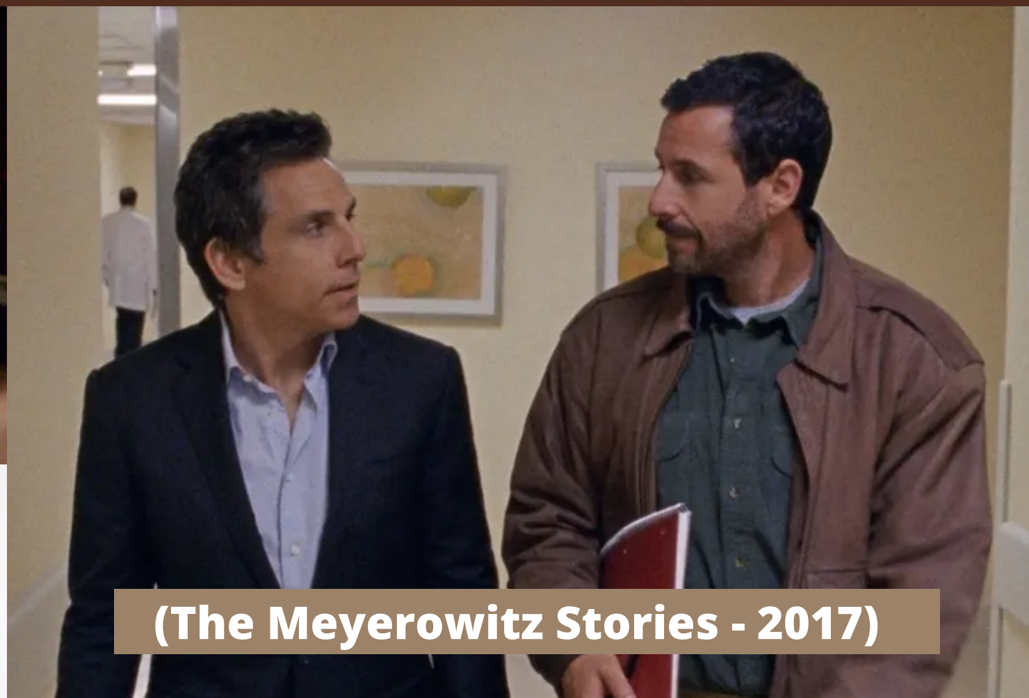
(The Meyerowitz Stories - 2017)