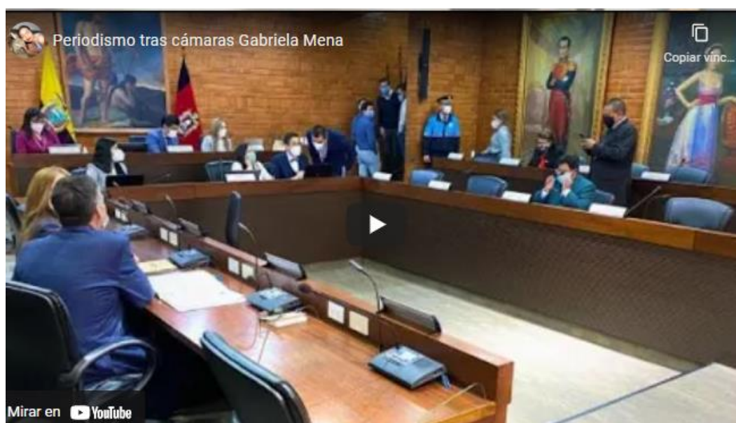
Figura 7. Captura de pantalla de primer formato