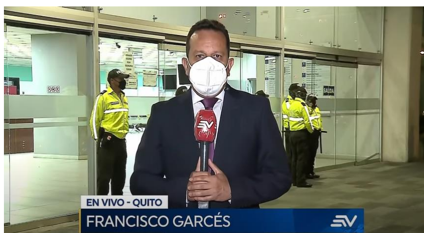
Figura 2. Informe Francisco Garcés sobre la audiencia para la destitución de Jorge Yunda como Alcalde de Quito. 19 de Julio del 2021.