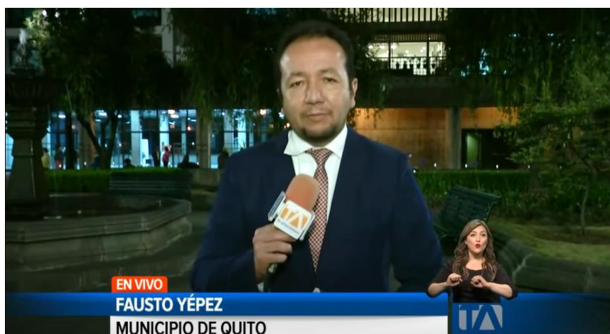
Figura 3. Informe Fausto Yépez sobre la restitución de Jorge Yunda como Alcalde de Quito. 30 de Julio del 2021

Tras once días, Jorge Yunda es restituido como alcalde de Quito el 30 de julio tras conocerse el dictamen de la Corte Provincial de Pichincha, que dejó sin efecto el proceso de remoción, así lo afirmó El Universo en su portal web. El exburgomaestre retornó a su despacho, ubicado en el centro histórico de Quito, donde entró a pie entre sus simpatizantes, policías y vallado que rodeaban la alcaldía de Quito. Teleamazonas y Ecuavisa fueron parte de esta cobertura.