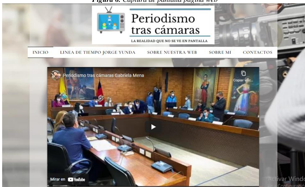
Figura 6. Captura de pantalla página web

https://periodismotrascama.wixsite.com/my-site-2