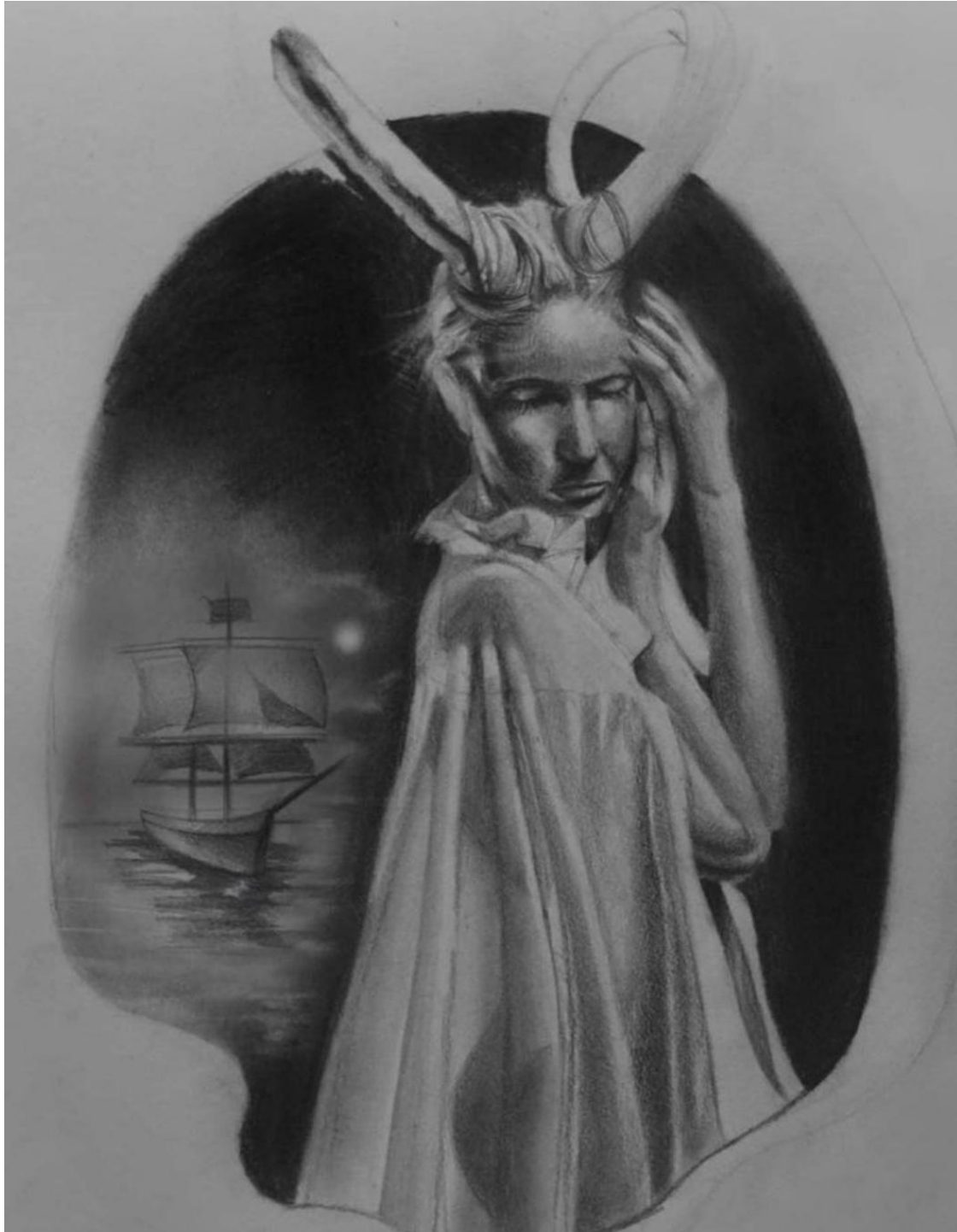
Figura 5: David Malán, Buena Voluntad, 2020.

cuanto a su composición, use dos elementos claves. Por una parte, una figura humana femenina que caracterizaba la libertad y la voluntad. Y, por otra parte, un navío que se acercaba a esta figura con una voluntad inquebrantable. De las tres ilustraciones, la tercera fue la que más me gustó pues interpretaba de manera exitosa mi intención.