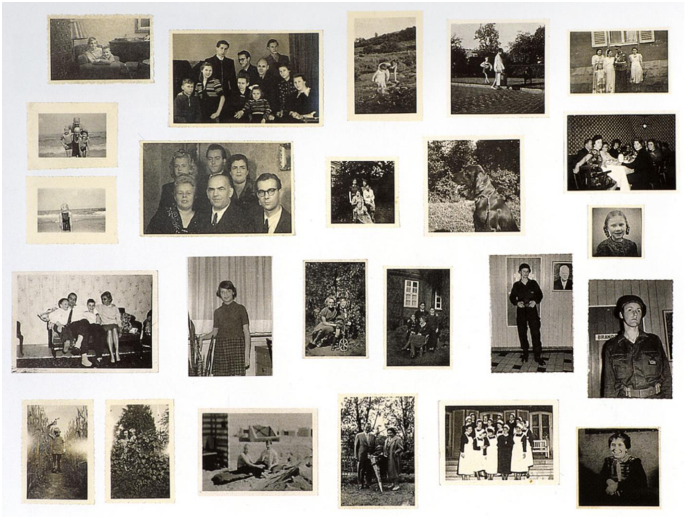
Figura 2: Gerhard Richter, Atlas, plate 2, Photo: http://www.medienkunstnetz.de/works/atlas/images/3/ , 1962.

Por consiguiente, esta obra tendrá un análisis de carácter “genético” el cual significa según Barbosa Martínez (2006) la forma de analizar una obra de arte como un derivado del compuesto social e histórico con la intención que fue realizada, es decir consiste en analizar el génesis social y los acontecimientos que hicieron posible su aparición” (p.391-414). Es por eso que no sólo las fotografías son partes indispensables de la misma, sino también los lugares y objetos que vengan a colación para la recolección de información. Ejemplo de ello es algún lugar u objeto de valor nostálgico. “Esto lo podemos comprobar en el método documental del proyecto de los Pasajes de Walter Benjamin, donde los principales pasajes de Europa son