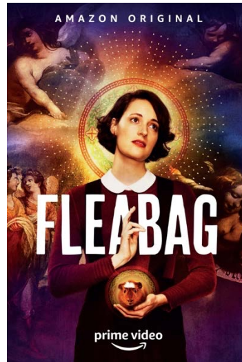
Figura 16: Serie - Fleabag