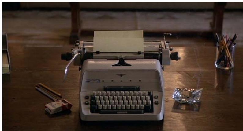
Figura 7: Referencia fotográfica