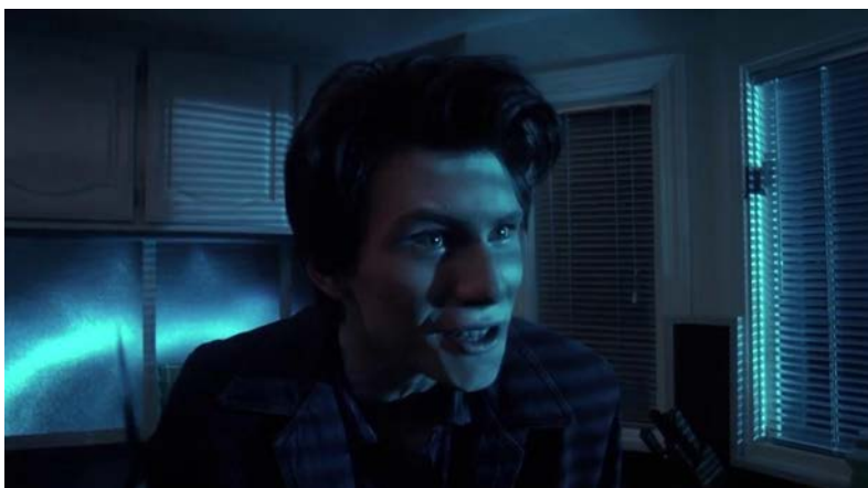
Figura 3: Referencia fotográfica