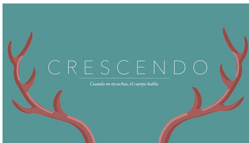
Figura 1: Afiche Crescendo