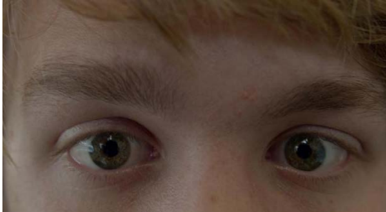
Figura 5: Referencia fotográfica

También se utilizarán planos abiertos con una composición más simétrica para representar la manera en la que el mundo en general ve a Nadia. Estos planos se utilizarán cuando se introduzca el personaje. También se utilizarán para mostrar los objetos con los que interactúa y así poder ver la personalidad de este personaje. De esta manera, el público podrá saber quién es Nadia.