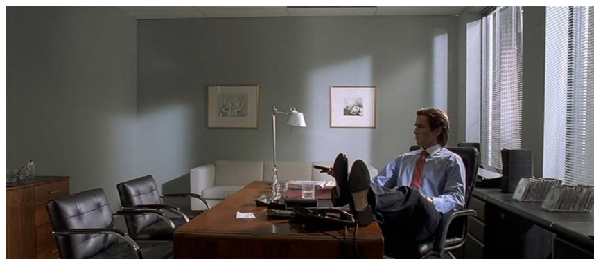
Figura 9: Referencia fotográfica