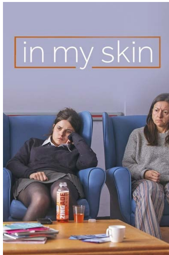
Figura 15: In My Skin