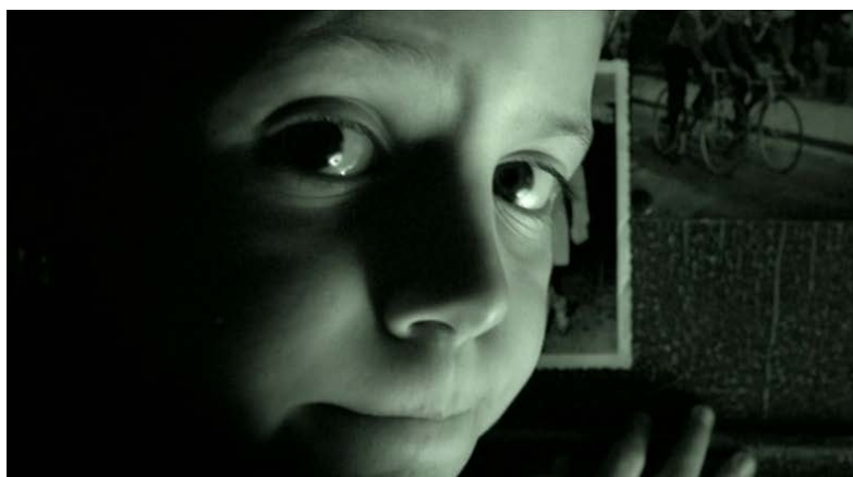
Figura 4: Referencia fotográfica