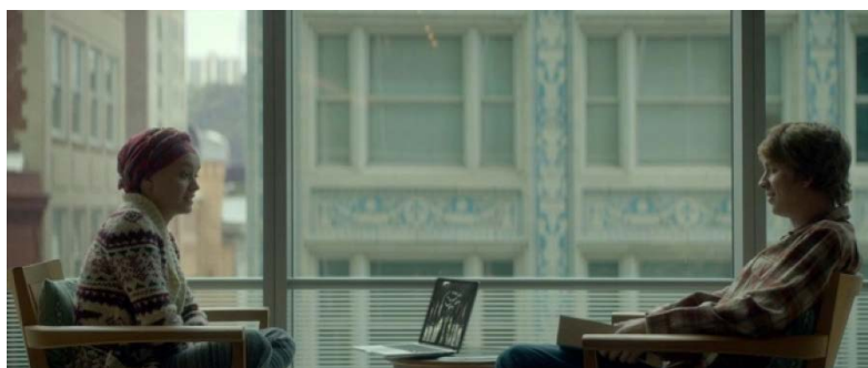
Figura 8: Referencia fotográfica