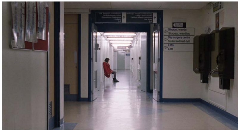
Figura 6: Referencia fotográfica

También se utilizarán planos abiertos con una composición más simétrica para representar la manera en la que el mundo en general ve a Nadia. Estos planos se utilizarán cuando se introduzca el personaje. También se utilizarán para mostrar los objetos con los que interactúa y así poder ver la personalidad de este personaje. De esta manera, el público podrá saber quién es Nadia.