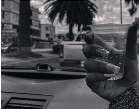
Figura 04: Parada 4, bebiendo aguardiente en el auto

Siguiendo por la vía principal del lugar de investigación, el consumo de bebidas como el aguardiente se mezcla con el consumo de bebidas como el whisky.