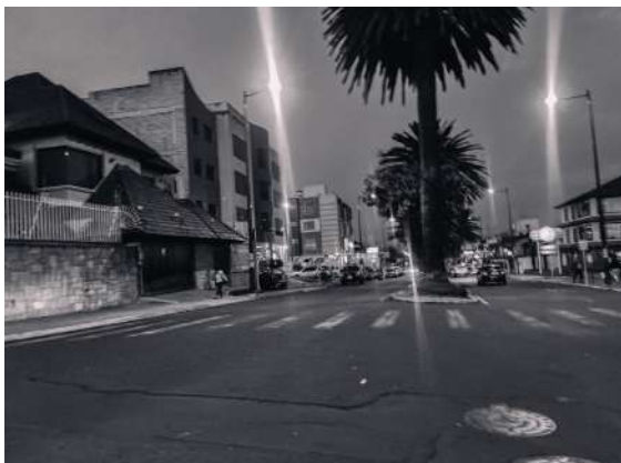
Figura 05: Parada 5, Ficoa en la noche

En el siguiente punto se visualiza el inicio de una madrugada llena de conductores en estado de ebriedad. La mayoría de tiendas y licorerías ya están cerradas, pero el tránsito sigue activo. Es recurrente leer medios digitales que registran incidentes que crean un entorno inseguro para los residentes de esta zona por accidentes en estado etílico y actitudes que generan disturbios en la zona.