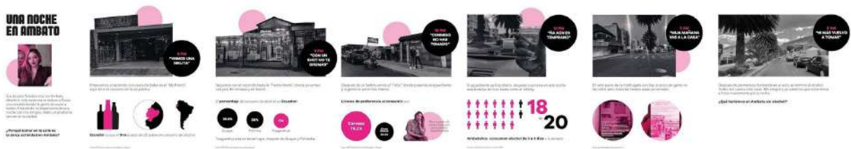
Figura 09: Pieza diseñada para Exhibición Híbrida

Una vez realizada la investigación del presente proyecto, contando con la información necesaria se realizó la pieza narrativa para la Exhibición de Diseño Híbrida, una línea de tiempo detallando punto por punto tanto la problemática de la investigación como los datos de la investigación.