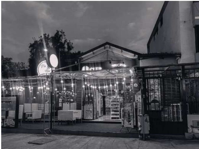
Figura 02: Segunda parada, Tienda Verde

Como segundo punto en el recorrido pasamos a la “Tienda Verde” , donde consumimos una java de cervezas y una botella de Switch, licor ecuatoriano Una frase que caracteriza este punto es “con un shot no te chumas”.