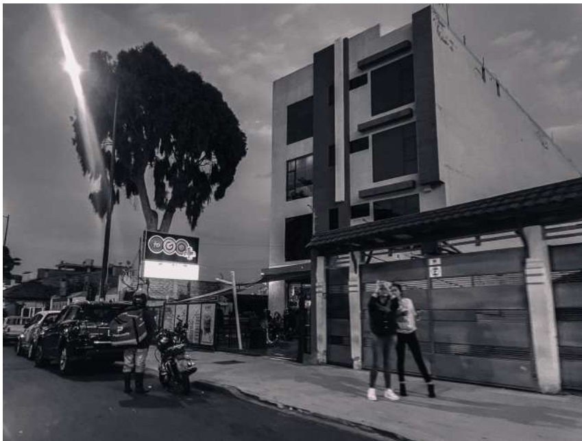
Figura 03: Tercera parada, Tienda “To Go”

En la línea de tiempo realizada para la exhibición, agrego datos cualitativos y cuantitativos realizados en el proceso. Por ejemplo, se realizó una encuesta de forma anónima a 20 ambateños con la pregunta: ¿Cuántos días a la semana consumes alcohol en este sitio? 18 personas respondieron que consumen bebidas alcohólicas de 3 a 4 días a la semana.