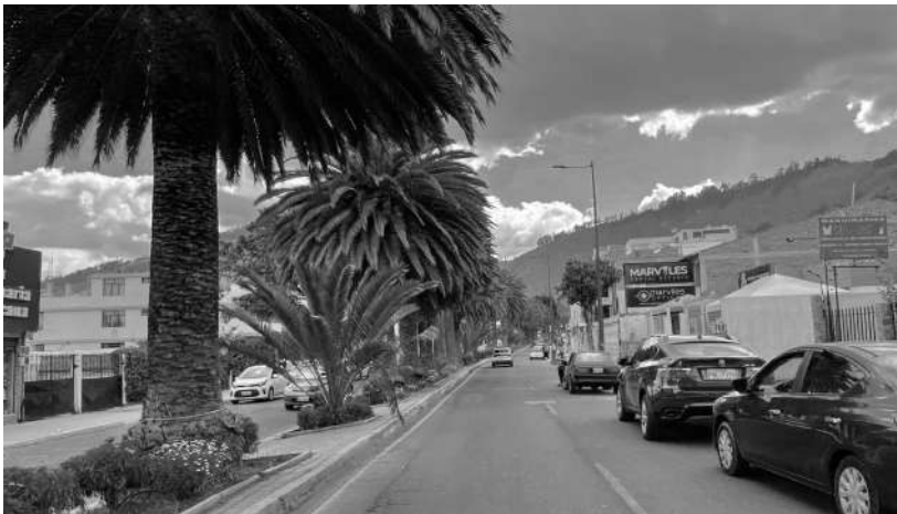
Figura 08: Foto Ficoa Avenidas Los Guaytambos

Ya pasadas las dos de la mañana, los distintos grupos se estacionan hasta el siguiente día a consumir alcohol en las veredas. Nuestro grupo regresa a sus hogares pasadas las 6 am, con la idea de seguir consumiendo alcohol nuevamente esa misma noche.