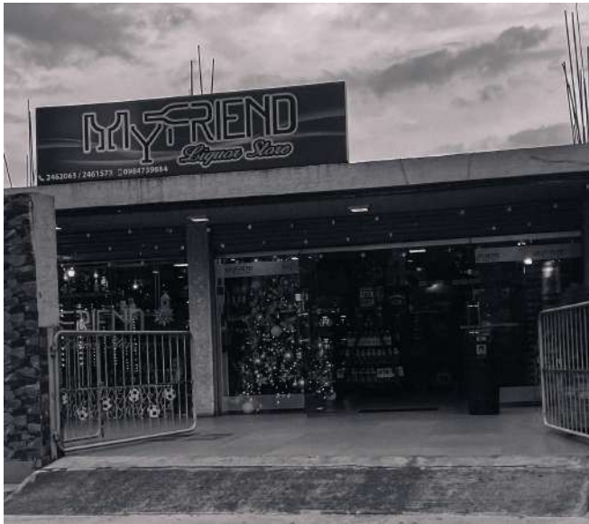
Figura 01: Primera parada, My Friend

Como segundo punto en el recorrido pasamos a la “Tienda Verde” , donde consumimos una java de cervezas y una botella de Switch, licor ecuatoriano Una frase que caracteriza este punto es “con un shot no te chumas”.