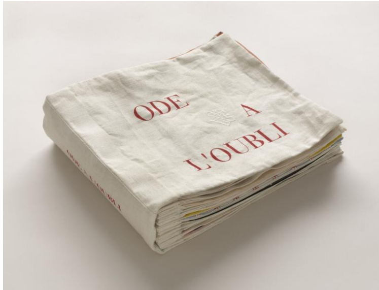
Figura 2 Louise Bourgeois, Ode á l'oubli, 1911-2010