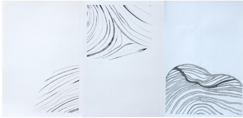
Figura 10 Emilia Torres, proceso de Parte de mí, 2023

Después de haber realizado modificaciones digitalmente, se realizó las ilustraciones en cartulina con rapidógrafo. Cada ilustración esta realizada con la técnica de puntillismo, ya que se quería generar esta transparencia.