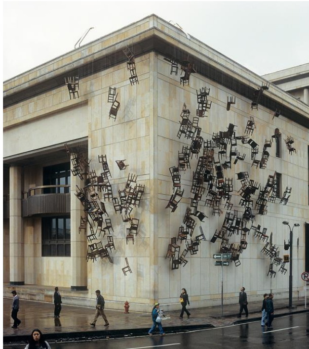
Figura 4 Doris Salcedo, Noviembre 6 y 7, 2002

Las obras de los artistas Do Ho Suh y Doris Salcedo, contraponen espacios que generan cierta reflexión de cómo nos afectan los ambientes donde habitamos. Aquellos lugares en los que sí se tiene un gran apego comienzan a interferir en el acoplamiento a nuevos lugares. El anhelo de volver a aquellos lugares donde sientes que eres tú, son los que tienen mayor memoria corporal y emocional; cada espacio tiene un impacto diferente en cada persona, el tiempo transcurre diferente, las emociones son diferentes. En el pasar del tiempo se genera un cúmulo de sentimientos distintos los cuales se conectan con las personas por más pequeños que sean. Los espacios guardan memorias al recoger todos estos recuerdos, recrearlos hace que se pueda regresar en el tiempo. Se genera un espacio de reflexión sobre todo lo vivido ahí con las demás personas que pasaron.