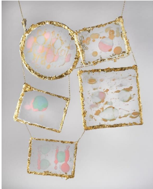
Figura 1 Karla Black, The rest imposed, 2018

Por esta razón, la exploración es imprescindible para este tipo de trabajos, ya que nos permite saber qué material funciona para expresar mejor la visión de cada artista y poder conectarnos con su trabajo. Conocer todas las bondades del material para poder utilizarlas y transmitir de mejor manera lo que se quiere decir.