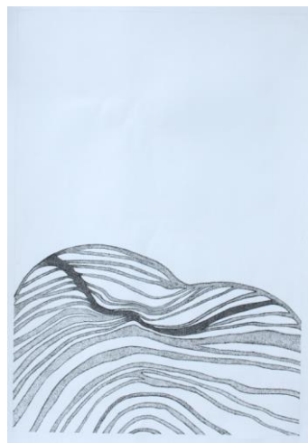
Figura 14 Emilia Torres, Parte de mí, 2023