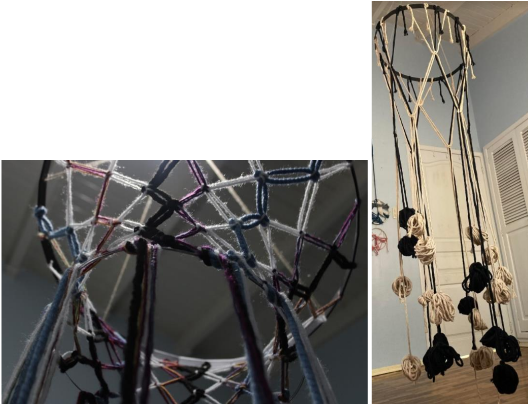
Figura 7 Emilia Torres, Entrelazado, 2023

Por otro lado, durante varios años tuve el sentimiento de no pertenencia a ningún lugar, los espacios que creía “seguros” como en el colegio e incluso mi propia casa, me producía un sentimiento profundo de soledad y el único lugar donde me sentía segura era yo. Yo era mi espacio seguro.