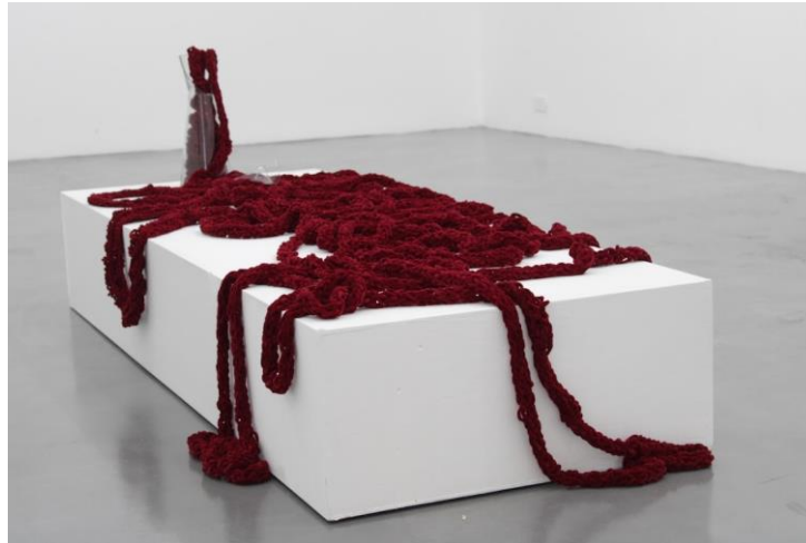
Figura 12 Emilia Torres, Desgarro, 2023

El proceso de investigación se demuestra mediante dos obras terminadas. Desgarro, es una instalación que incluye un tejido de más de 20 metros de largo y un jarrón roto, desde donde sale el tejido. Esta obra comprende el acto de sacar todas las emociones contenidas en el tiempo que sea necesario para poder sanar.