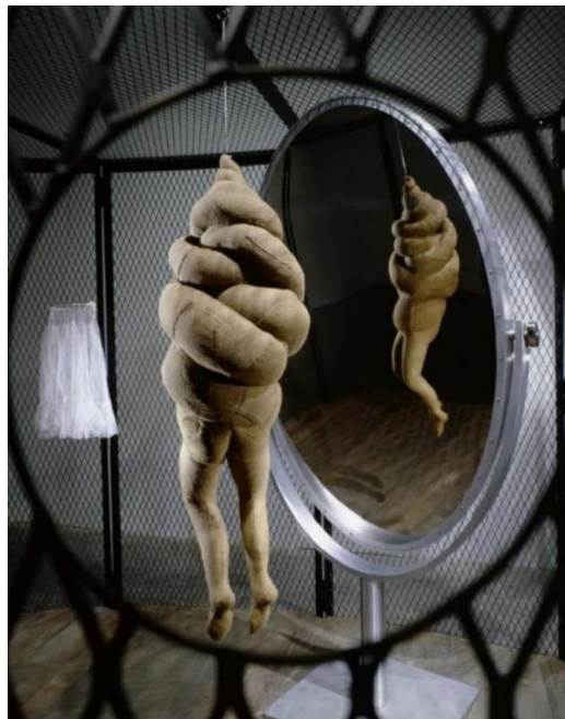
Figura 5 Louise Bourgeois, CELL XXVI, 2013

Louise Bourgeois crea esta obra (CELL XXVI, 2013) que forma parte de una serie de obras escenográficas e interactivas. Con estas instalaciones lo que intenta generar es una ilusión de adentramiento en su memoria, ya que los espectadores pueden recorrer la instalación, haciendo esta analogía de entrar en la mente del artista. Louise Bourgeois intenta conectar con sus traumas generando estos espacios que se vuelven liberadores para ella y que son su forma de regresar al pasado para perdonar y olvidar. “Como individuos e integrantes de una sociedad, necesitamos el pasado para construir y ancorar nuestras identidades y alimentar una visión de futuro” (Guasch, 2005).