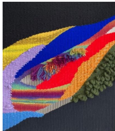
Figura 6 Emilia Torres, Unión, 2022

El tejido ha sido el medio que más me ha permitido explorar, expresar la memoria, darle a cada lana una emoción diferente y ser representada con un color específico, una textura que muestre esa emoción en su totalidad. Al momento de realizar el tejido de la figura 6, de ver la interacción de las diferentes lanas, dejar espacios de memoria sin tejer, me permitió reconocer que en este trabajo no me produjo emociones que salgan del recuerdo. Este telar forma parte únicamente del proceso de creación para indagar en el tema.