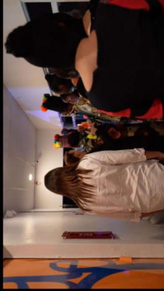
Aspect Ratio 16:9