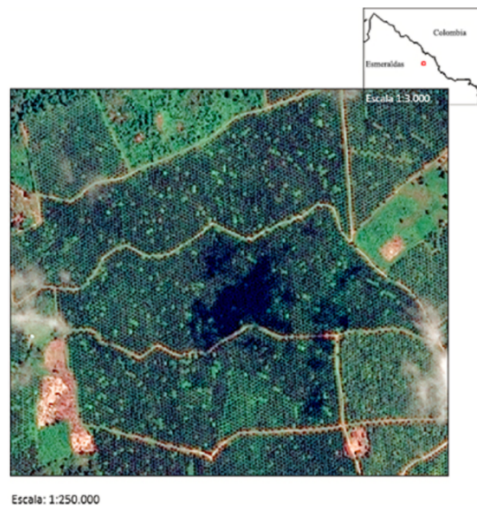
Gráfico No. 3 Plantaciones Mixtas de Coca y Palma.

28