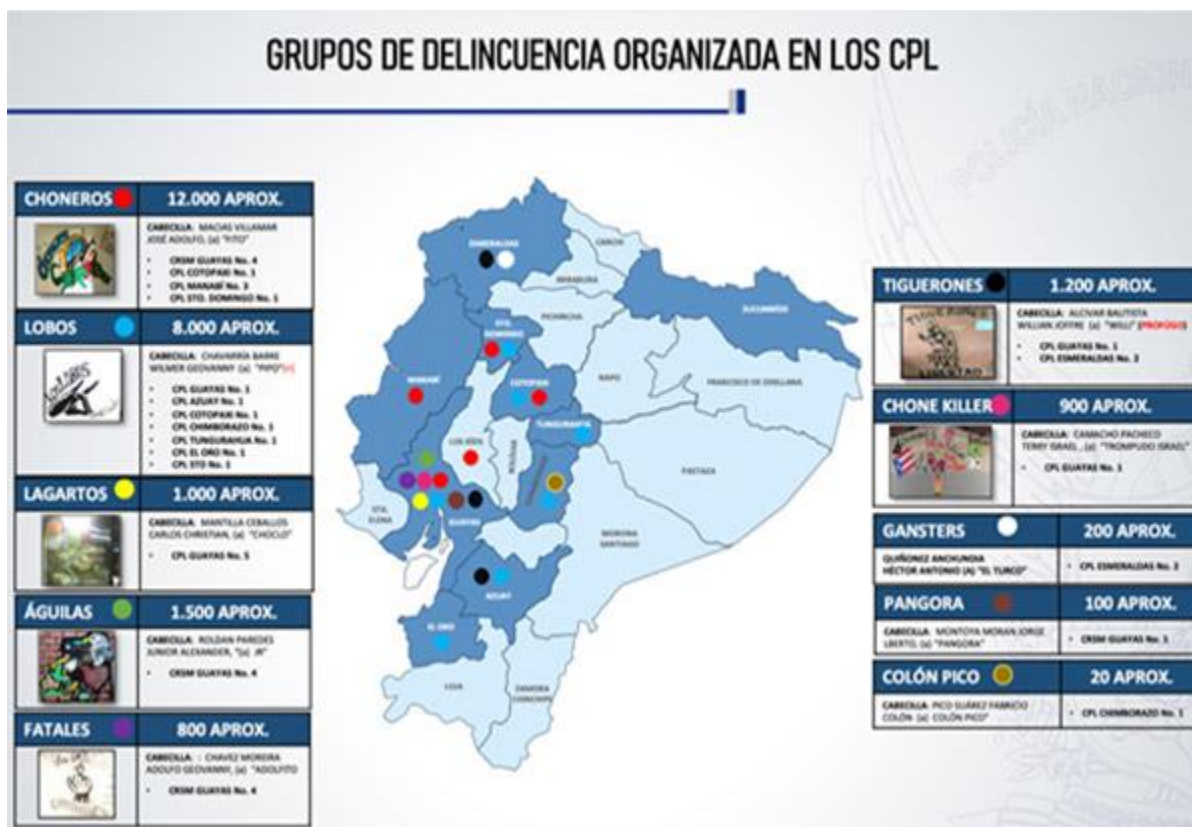
Anexo 3: Radiografía de las organizaciones que operan en las cárceles, Código Vidrio 2021

enfrentamiento entre las bandas, ha provocado una inseguridad en el territorio ecuatoriano teniendo como consecuencias asesinatos, sicariatos, extorsiones, robos, bombardeos en si toda clase de actividad ilícita que se está viviendo a gran magnitud.