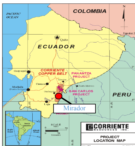
Figura 1: mapa de ubicación de los proyectos de Ecuacorriente en el Ecuador

cuidado del medio ambiente no son opuestos, sino la minería se puede hacer de una manera responsable con el medio ambiente y la comunidad, bajo estrictas regulaciones gubernamentales. Como mencionan, la compañía está comprometida con la minería responsable que cuida el ambiente y apoya el desarrollo social comunitario. Es innovadora en políticas, acciones y procedimientos modernos dentro de la actividad minera en el Ecuador.