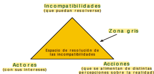
Figura 3: Etapas del proceso de negociación Autor Balvin, 2005

El proceso de negociación en conflictos socio ambientales comprende varios momentos. En primer lugar se da lugar a una fase de pre-negociación donde la razón del conflicto es analizada por todas las partes involucradas para poder dar paso a una negociación. En segundo lugar, el momento de la negociación es cuando los actores discuten y analizan las diferentes alternativas para llegar a un consenso. En tercer y último lugar, la fase de post-negociación se ocupa de implementar y monitorear los acuerdos llegados entre las partes. En el siguiente gráfico se puede observar el proceso de negociación (Balvin, 2005).