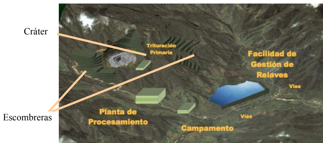
Figura 2: Ubicación de las principales instalaciones del proyecto Mirador.

La infraestructura del proyecto será colocada en su mayoría en zonas intervenidas, pues la relavera, el campamento, la planta y gran parte de la escombrera del lado Este, se encuentran en zonas de pastizales o bosques intervenidos, mientras que el tajo de la mina y la mayor parte de la escombrera sur, se encuentran en bosques secundarios en recuperación. Dentro de los bosques secundarios se registran especies de flora y fauna de importancia. Por esta razón, se propone el rescate respectivo, y su cautiverio en zoológicos e invernaderos, para asegurar su protección.