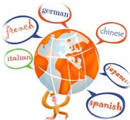
Ilustración 1: Bilingüismo