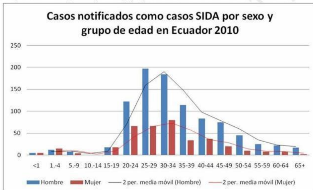
Gráfico 3. Casos notificados por sexo y grupo de edad en los casos SIDA en Ecuador 2010.