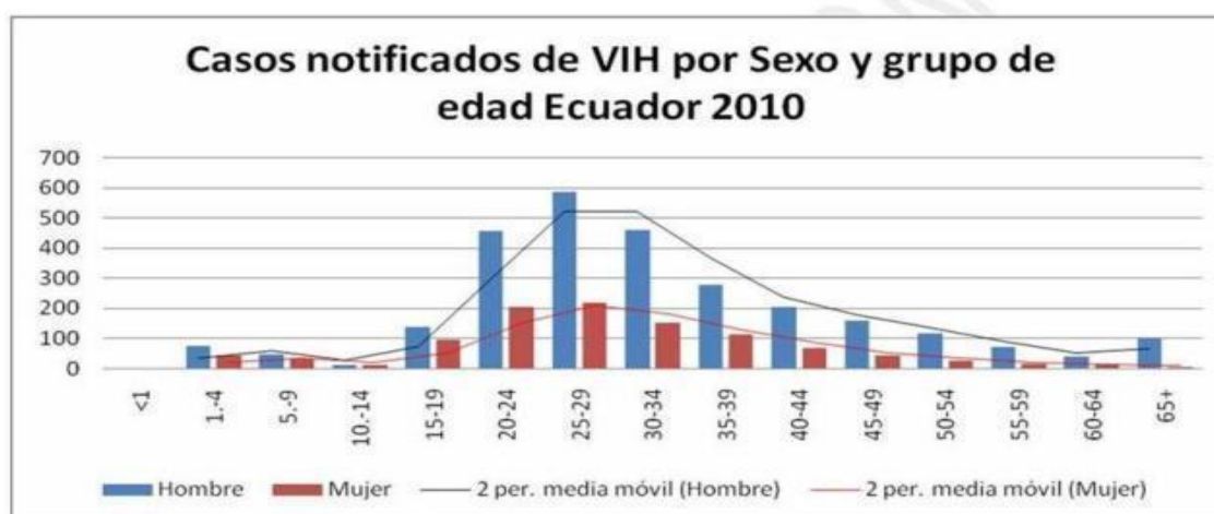
Gráfico 4. Casos notificados por sexo y grupo de edad en los casos VIH en Ecuador 2010.