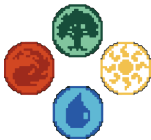
Figura 7. Elemento.