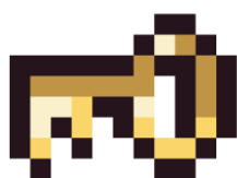
Figura 8. Llave.