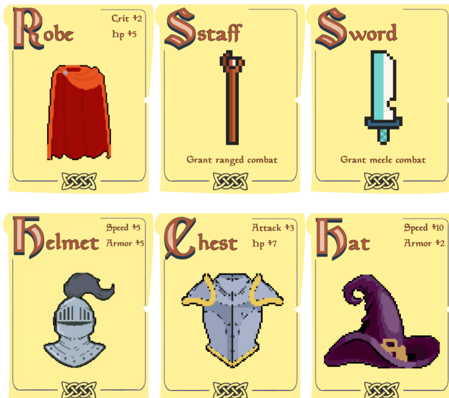
Figura 6. Cartas. Brindan diferentes estadísticas al personaje y se encargan de proporcionar el combate que el héroe tendrá en esa sala.