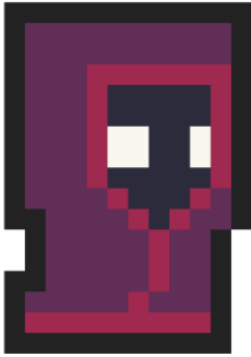
Figura 1. Absalon, antagonista de la historia.