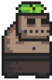
Figura 4. Enemigo, Zombie.