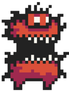
Figura 5. Enemigo, Demonio.