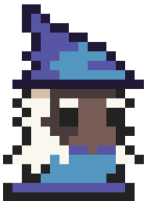
Figura 3. Xildur, El sabio que ayuda al personaje.