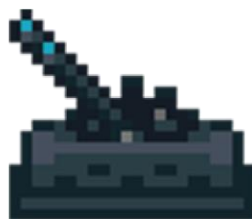
Figura 9. Palanca.