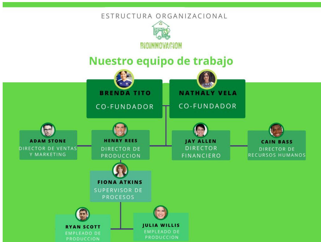
Figura 1. Estructura organizacional del proyecto

Se muestra la organización que se pretende desarrollar en BIOINNOVACION, dividido según las áreas de interés con sus directores y personal de apoyo dentro del área de producción.