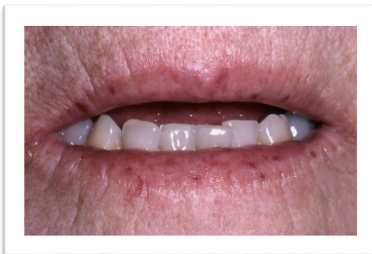
Figura 2. Limitación apertura de la boca

Se observa una piel muy pálida, endurecida y lisa a nivel de dedos de manos, pies y cara, como se observa en la figura 2. Además de limitación de la apertura bucal.