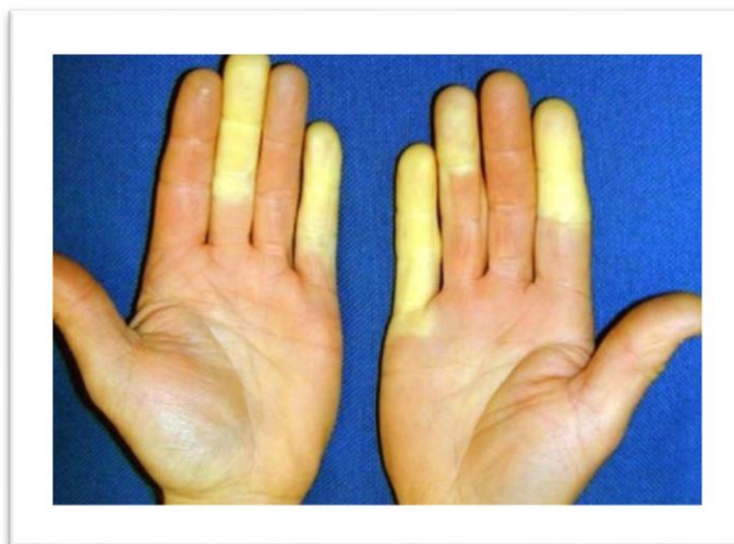
Figura 4. Fenómeno de Raynaud.

Durante los siguientes años, estos fueron los únicos síntomas de la enfermedad, a excepción de algunas infecciones ocasionales bacterianas y por hongos, que han requerido hospitalización.