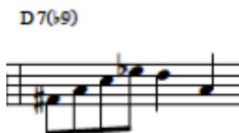
Figura 4, ejemplo 2 súper estructuras.

También podemos encontrar esta técnica de improvisación en los compases 7( D7 (b9)), 15 (D7 (b9)). (fig, 4,5).