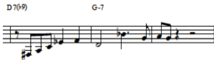
Figura 3. uso del 3 al b9

El “3 to b9”, es una técnica adoptado por Chet Baker tanto para improvisar en trompeta como en canto, un claro ejemplo es en el compas 45, con el acorde de D7(b9) que comienza en el 3er grado, va al 5to grado, 7mo grado y a una negra que es el b9, la cual sirve como nota de paso junto al 3er grado de D7(b9), para resolver al siguiente compas. (fig. 3).