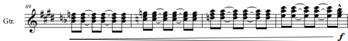
Figura 2. Acompañamiento en crescendo 4 .

Sin embargo, este no es el único caso en el que Metheny toma como un recurso a favor el hecho de ser el único instrumento melódico-armónico dentro del trío, pues lo utiliza también para crear ambientes más cargados de tensión armónica y jugar con la dinámica de su interpretación ( Figura 2 ); o inclusive, lo utiliza para crear chord melodies 3 dentro del solo. ( Figura 3 ).