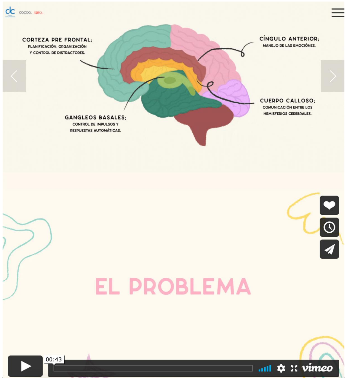
Figura 13: Exhibición, emoción - El problema