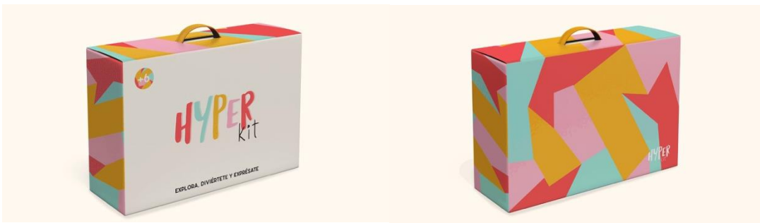
Figura 1: Maletín: Hyper Kit , parte frontal y trasera

Hyper Kit contiene un packaging en forma de maletín (ver figura 1) el cual contiene: 4 cuentos de la colección “ Conociendo mi Mundo ” (ver figuras 2 y 3), un juego de cartas (ver figura 4), una libreta (ver figura 5) y crayones de colores (ver figura 6).