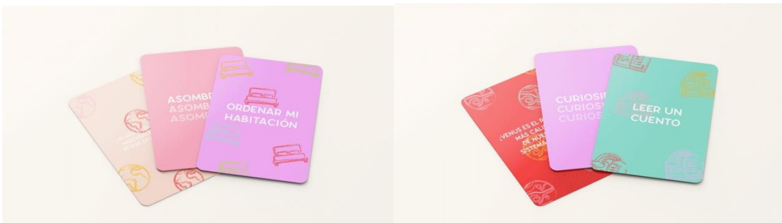
Figura 6: Juego de cartas - Referencia de actividades 3 y 4