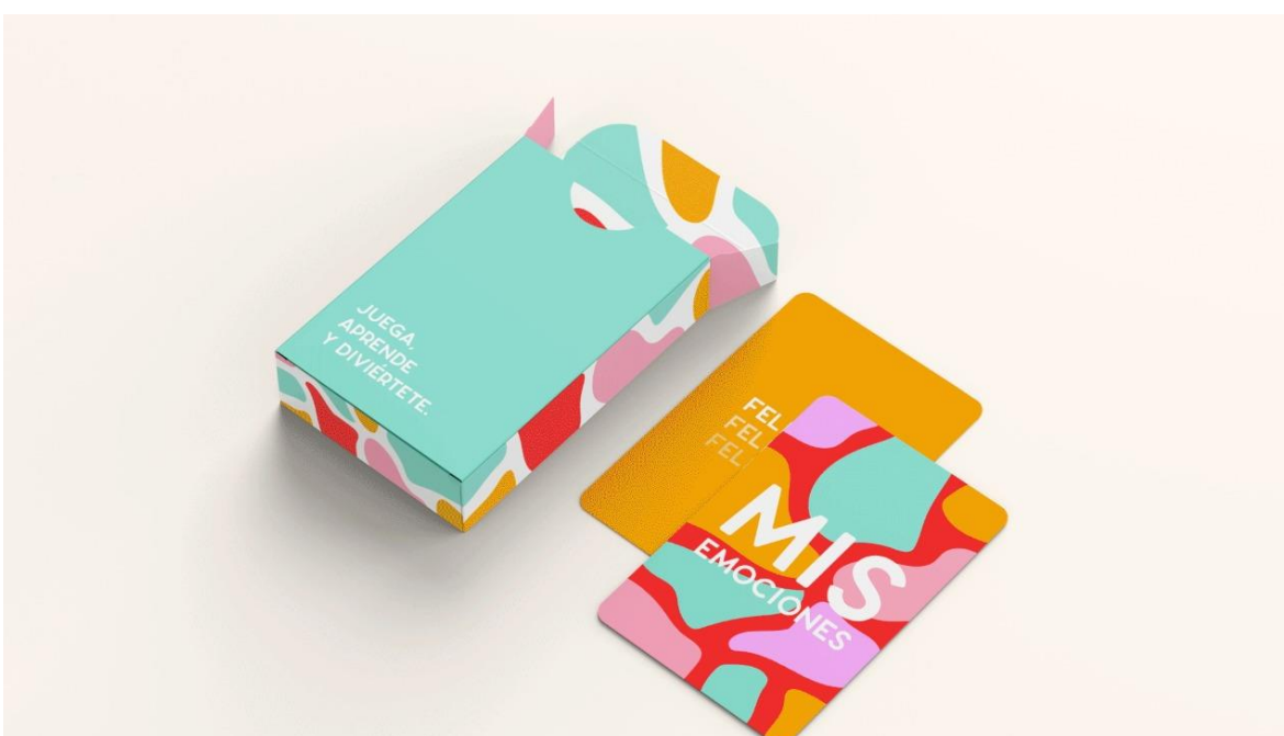
Figura 4: Juego de cartas – Empaque