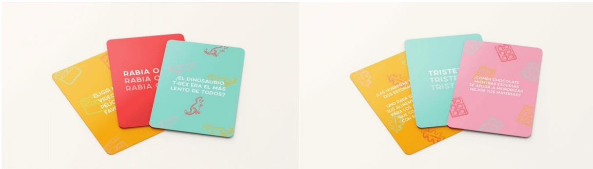
Figura 5: juego de cartas - Referencia de actividades 1 y 2