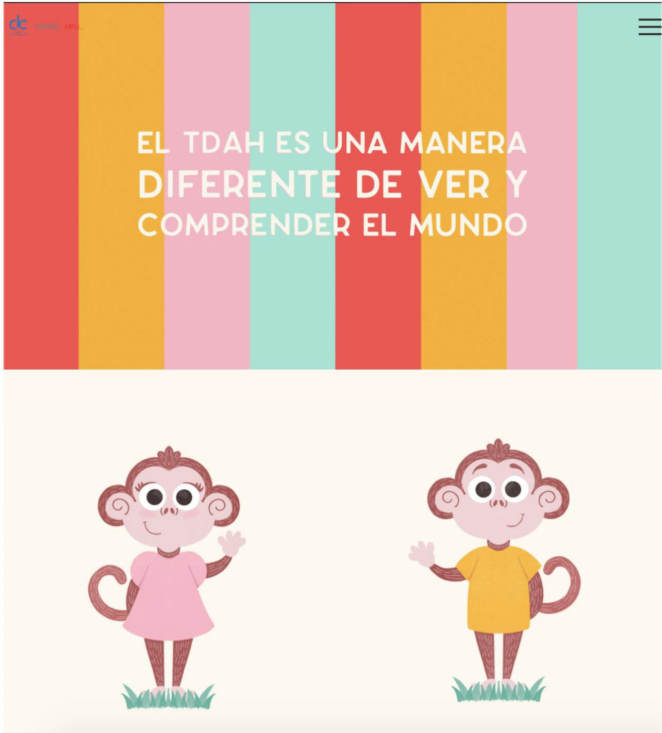
Figura 14: Exhibición, emoción - Los personajes