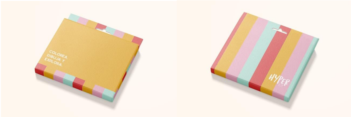
Figura 8: Crayones para colorear - parte frontal y trasera

El juego de cartas tiene como propósito que los niños encuentren actividades que les ayuden a motivarse en su día. Existen 3 diferentes categorías para que cada niño con TDAH exprese lo que siente y lo que le gusta de una manera libre y divertida. Dentro de todas las categorías, los niños tienen la opción de dibujar o escribir en su libreta cómo se sintieron con la actividad o qué es lo que más les gustó, de esta manera pueden expresarse mediante el dibujo.