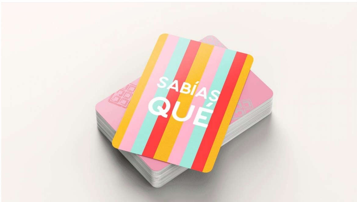
Figura 10: Juego de cartas, categoría - Sabías qué