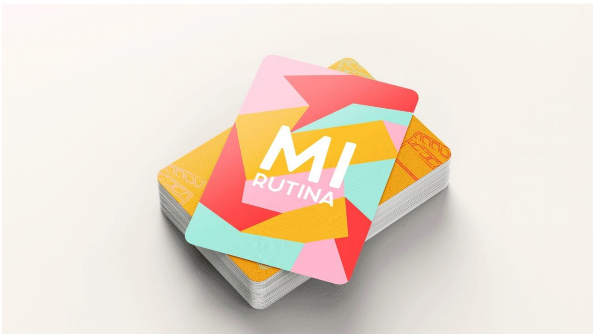
Figura 9: Juego de cartas, categoría - Mi rutina

Mis emociones: el juego de las emociones consiste en que los niños estén conscientes de lo que sienten y por qué. Ellos deberán escoger cualquier carta y representar con gestos o sonidos la emoción que elijan, sus padres deberán adivinar qué emoción se está actuando y juntos imaginar un escenario en el que se podría sentir esa emoción (ver figura 11).