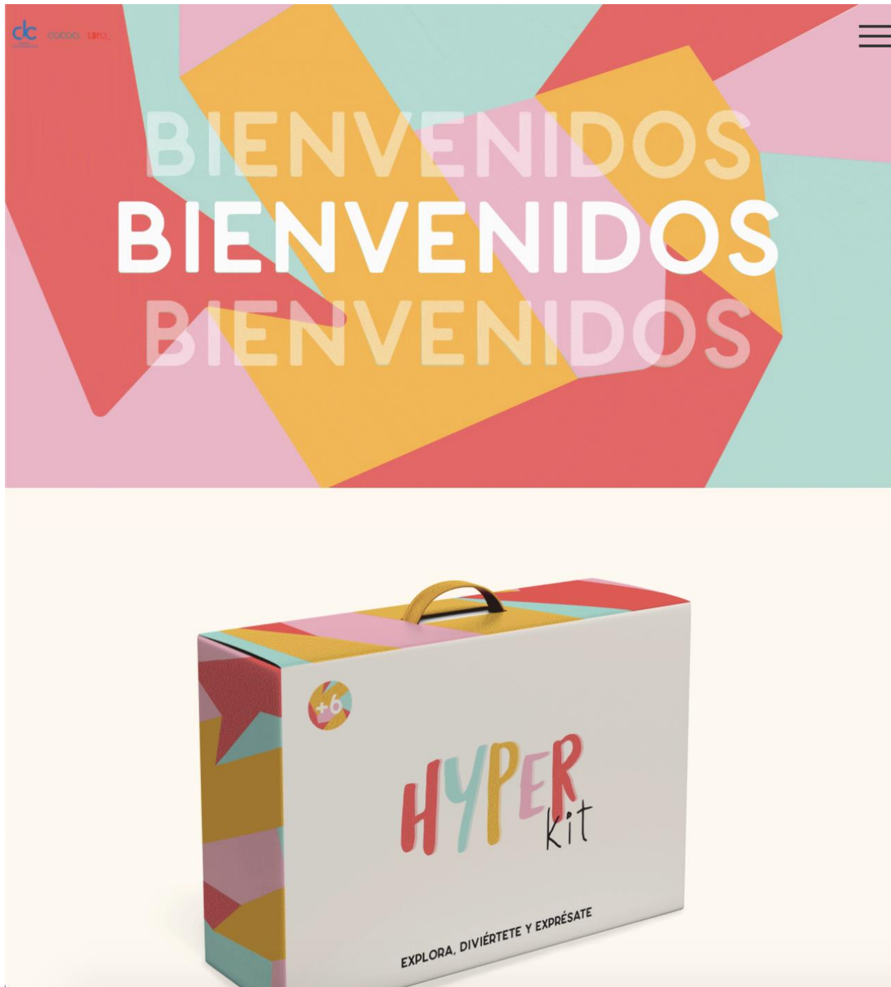
Figura 15: Exhibición, sensación - Hyper Kit