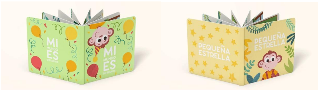
Figura 3: Cuentos Conociendo mi mundo - “Mi mundo es diferente”, “Pequeña estrella”