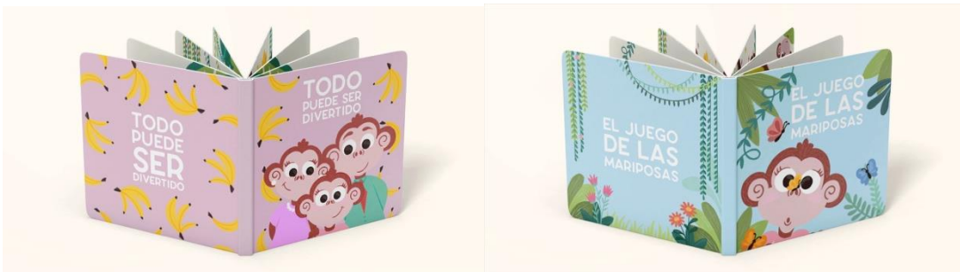
Figura 2: Cuentos Conociendo mi mundo - “ El juego de las mariposas ”, “ Todo puede ser divertido ”