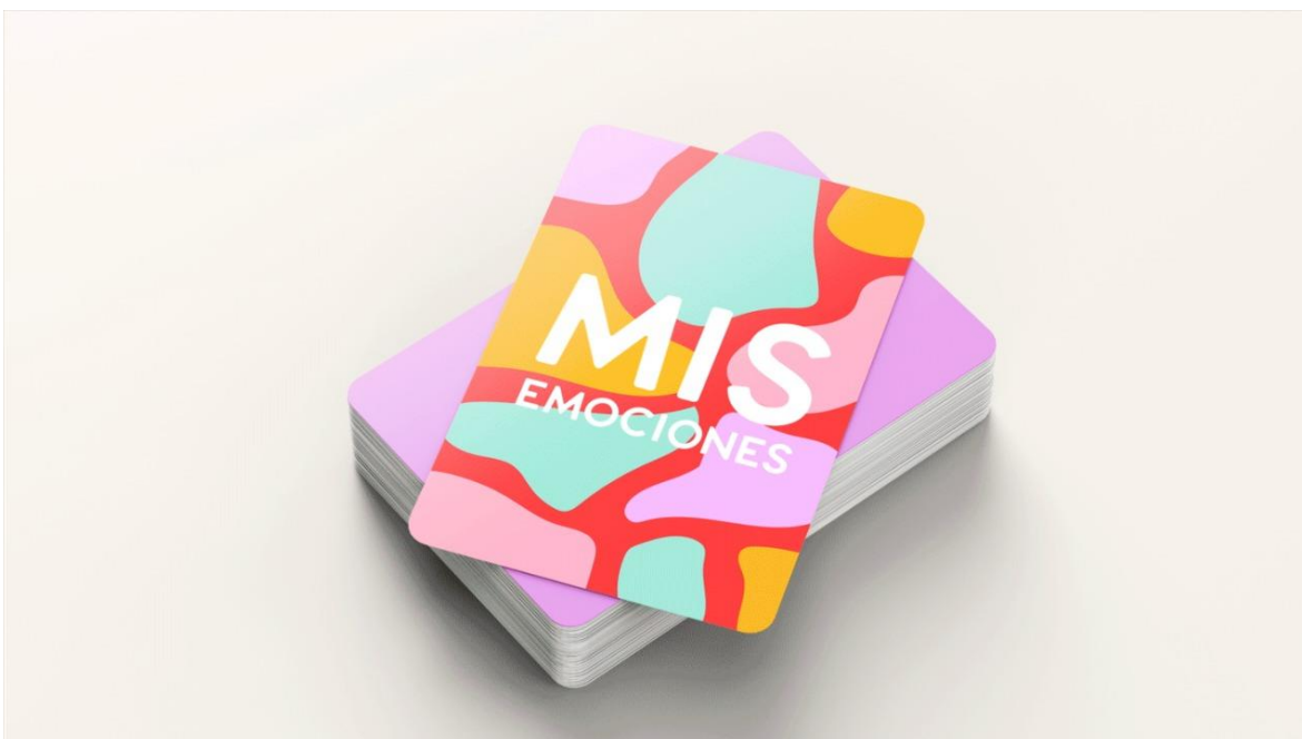
Figura 11: Juego de cartas, categoría - Mis emociones