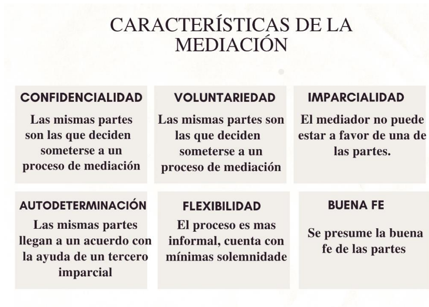
Gráfico No. 2. Características de la mediación.