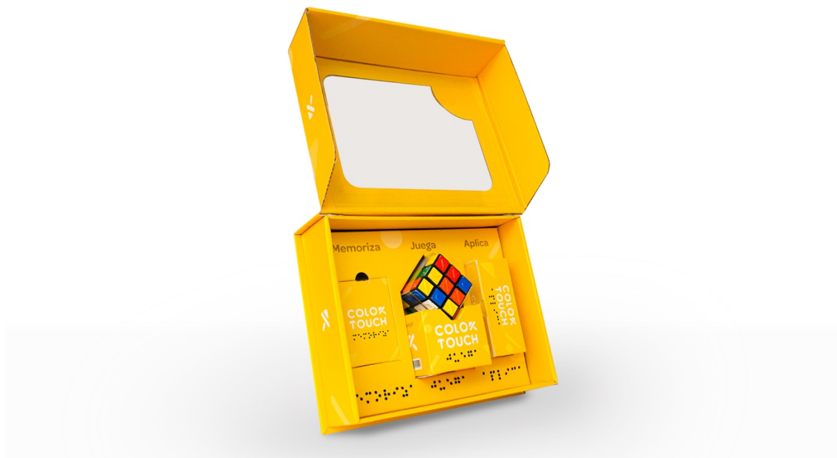
Figura 8. Kit Color Touch

Al final los tres elementos se ubican dentro de un kit el cual se enfocó en desarrollar un packaging atractivo y adaptado a cada uno de los elementos de cada etapa.