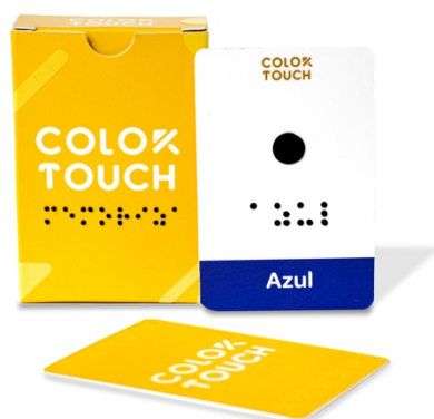
Figura 5. ¡Memoriza!

El primero, es ¡Memoriza!, compuesto por una caja de 13 cartas de memorización, la cual consta cada una con su respectiva figura que representa un color. Basado en la construcción inicial de colores primarios, para así continuar con los secundarios y terciarios.