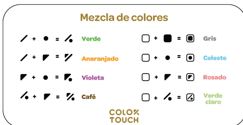
Figura 1. Mezcla de colores Color Touch

El color verde es el resultado de la mezcla del color amarillo y azul, en el sistema Color Touch, el color verde se obtiene con la combinación de la línea diagonal y el círculo relleno.