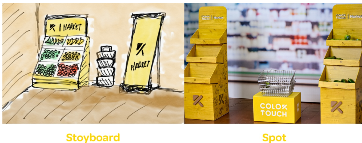
Figura 9. Storyboard

De las tres opciones se optó por la creación de un spot de un supermercado, debido a que actualmente en estos lugares elementos como frutas y verduras no cuentan con una simbología que permita a las personas no videntes identificar el color de estas.