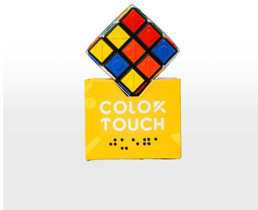
Figura 6. ¡Juega!

La segunda fase es ¡Juega!, presentada por un cubo de Rubik inclusivo, en donde cada cara del mismo cuenta con las figuras respectivas de cada color en relieve para poder sentir y divertirse jugando mientras se lo arma.