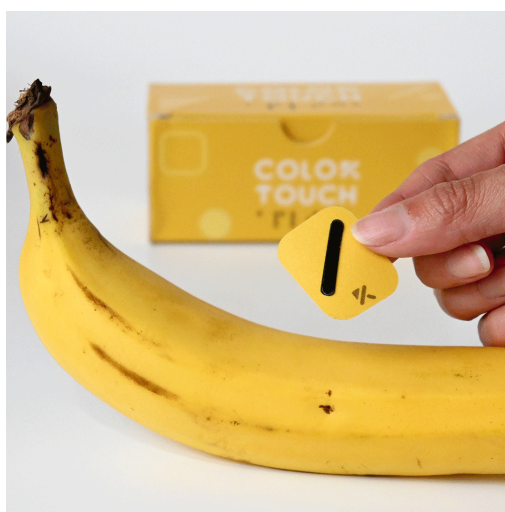
Figura 7. ¡Aplica!

Nuestra tercera fase es ¡Aplica!, basada en el uso cotidiano de las actividades con nuestro sistema, el cual incluye stickers y bordados con relieve representando todos los colores aprendidos, los cuales puedas colocar en tus prendas de ropa o incluso a tus alimentos.