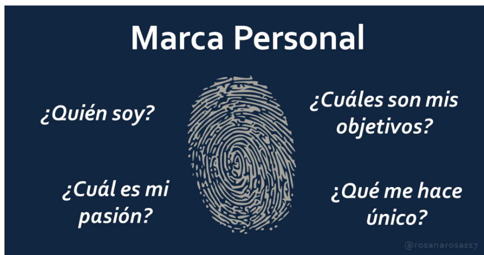
Ilustración 6. Marca Personal