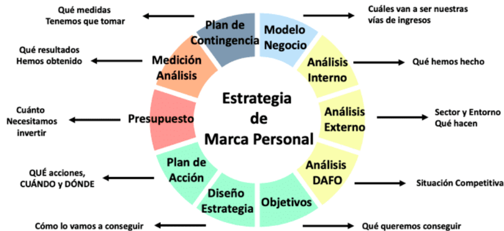
Ilustración 5. Estrategia marca personal