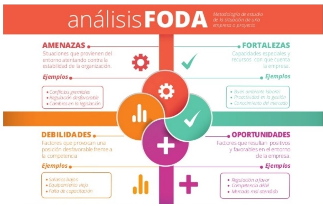
Ilustración 1. Análisis FODA Anexo 1