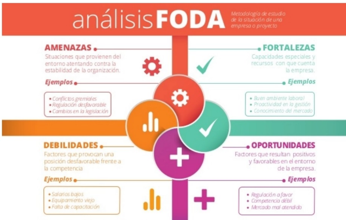
Ilustración 1. Análisis FODA