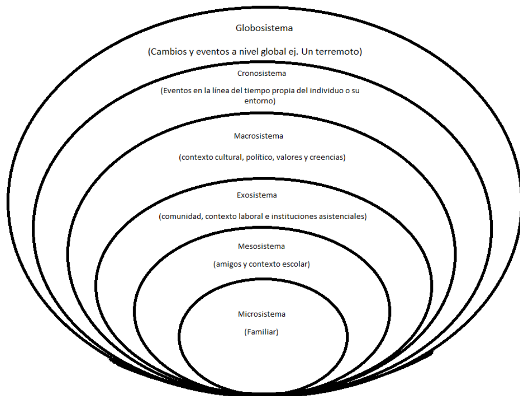
Ilustración 2. Econograma, sistema ecológico Bronfenbrenner, recuperado de Fundación Universitaria los libertadores, 2017.

El microsistema, en donde los roles e interacciones van relacionados con el ambiente cotidiano o en la familia cercana; el mesosistema está influenciado por otros ambientes relacionados con los amigos y el ambiente escolar, exosistema es aquel que en donde ya interactúa el sistema laboral o la comunidad, macrosistema habla sobre la cultura, política, los valores y las creencias, etc. (Crawford, 2020). Según Parra y Rubio (2017) existe una relación entre el sistema ecológico de Bronfenbrenner y el estigma debido a que desde el microsistema se empieza a generar estas cogniciones equivocadas sobre la salud mental y se refuerza en el macrosistema debido a la participación de más actores y relaciones (Crawford, 2020; Parra y Rubio, 2017).