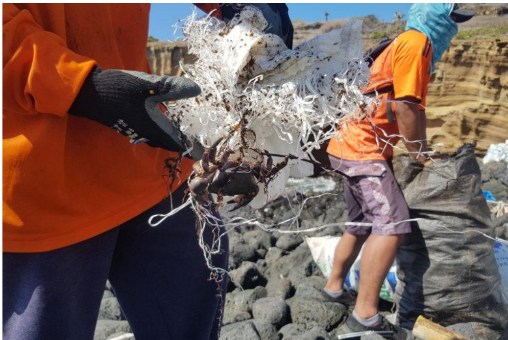
Figura 7. Limpieza costera.

A pesar de los proyectos, limpiezas costeras y campañas para reducir el plástico en Galápagos aun no se ha logrado encontrar una solución exacta para erradicar esta problemática. La llegada de plásticos a las islas cada día es mayor, varios estudios realizados por Juan Pablo Muñoz señalan que alrededor de 30 especies de animales se han visto enredadas o han ingerido plásticos. La mayor parte de la basura plástica que llega a la zona costera de Galápagos llega por vía marítima la cuál es impulsada por las corrientes marinas que rodean el Archipiélago.