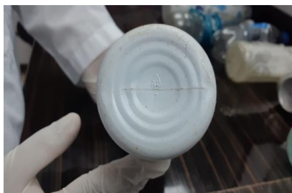
Figura 3. Identificación del tipo de plástico. Foto: