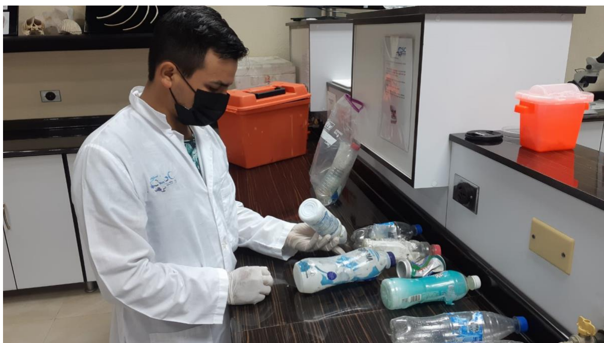
Figura 1. Identificación de las muestras recolectadas.

La contaminación plástica en los ecosistemas marinos se está convirtiendo en una problemática casi irreversible a nivel mundial incluso lugares muy remotos se han visto afectados por la contaminación plástica. Se considera importante conocer los tipos de plásticos y tamaños para hacer una identificación del daño ambiental que están produciendo en Galápagos. Los tipos de plásticos que llegan por vía marítima tienen una conformación diferente, algunos son mayor resistentes al calor (PET) otros de doble uso y menor nivel de contaminación (PET PP, HDPE)