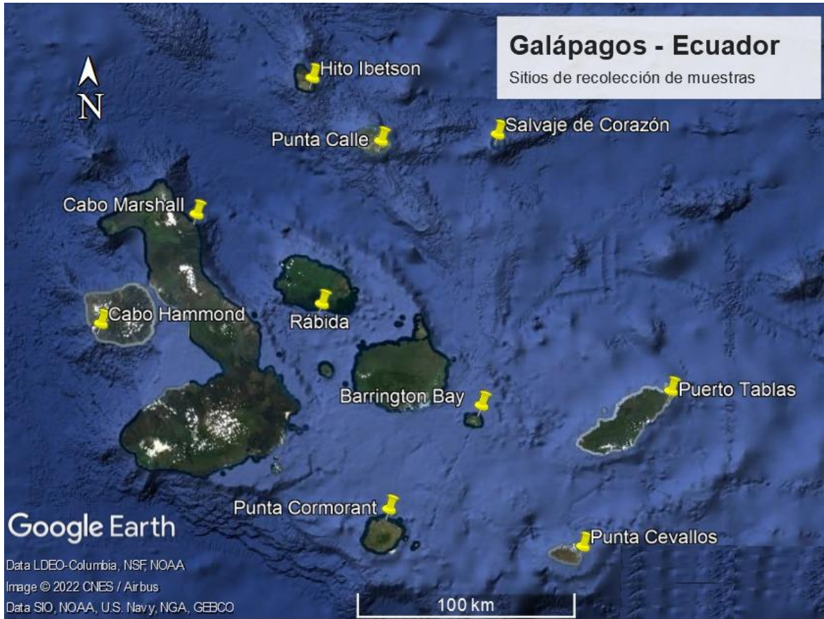
Figura 6. Sitios de muestreo