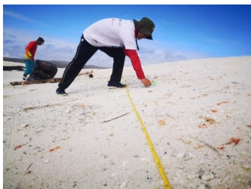
Figura 2. Recolección de muestras.