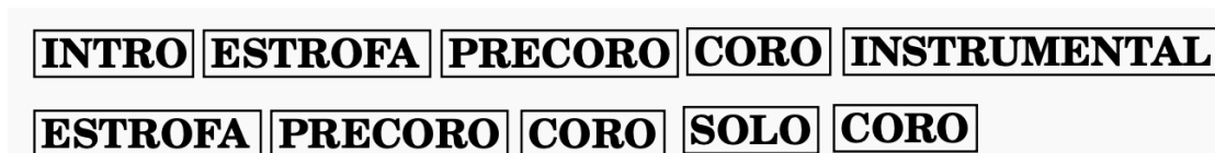
Figura #1. Forma de la obra.

La forma establecida para el proyecto sería “canción”