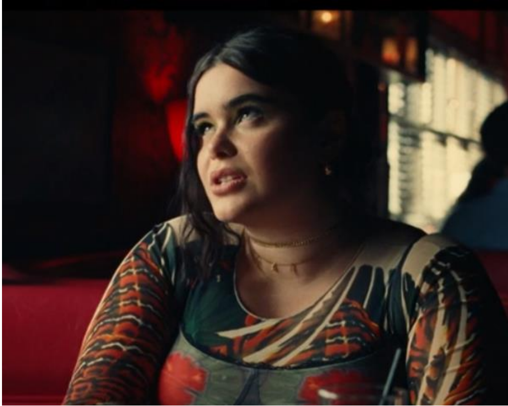
Ilustración 4 Temporada 2, Episodio 6, 16:41