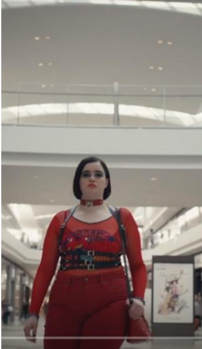
Ilustración 3 Temporada 1, Cap 5, 17:08