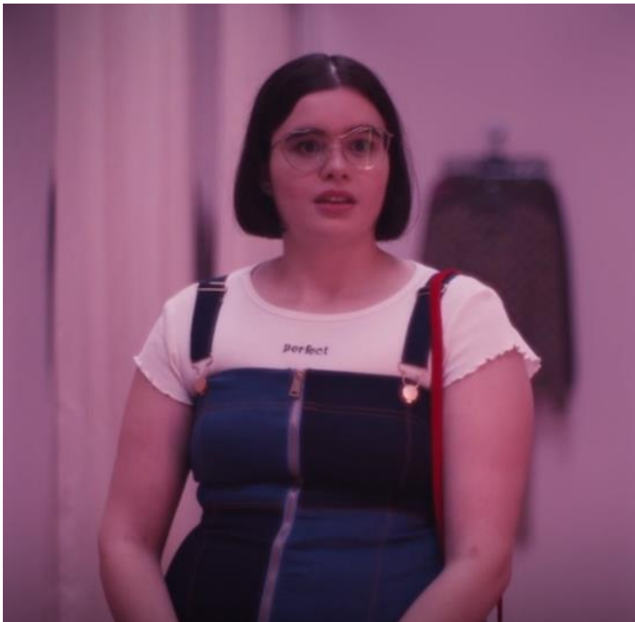
Ilustración 1 Euphoria Temporada 1, Cap 3, 45:20

Vemos una introducción a su estilo. Le gusta el layering 19 sin embargo lo lleva de una forma recatada. Usa lentes de marco ancho y su pelo corto peinado de forma pareja. Todo esto nos da a entender que ella se esta escondiendo y que su objetivo no es llamar la atención de quienes la rodean. En cuanto al maquillaje no la vemos llevar ningún tipo de maquillaje durante esta etapa, su estilo se ve natural.