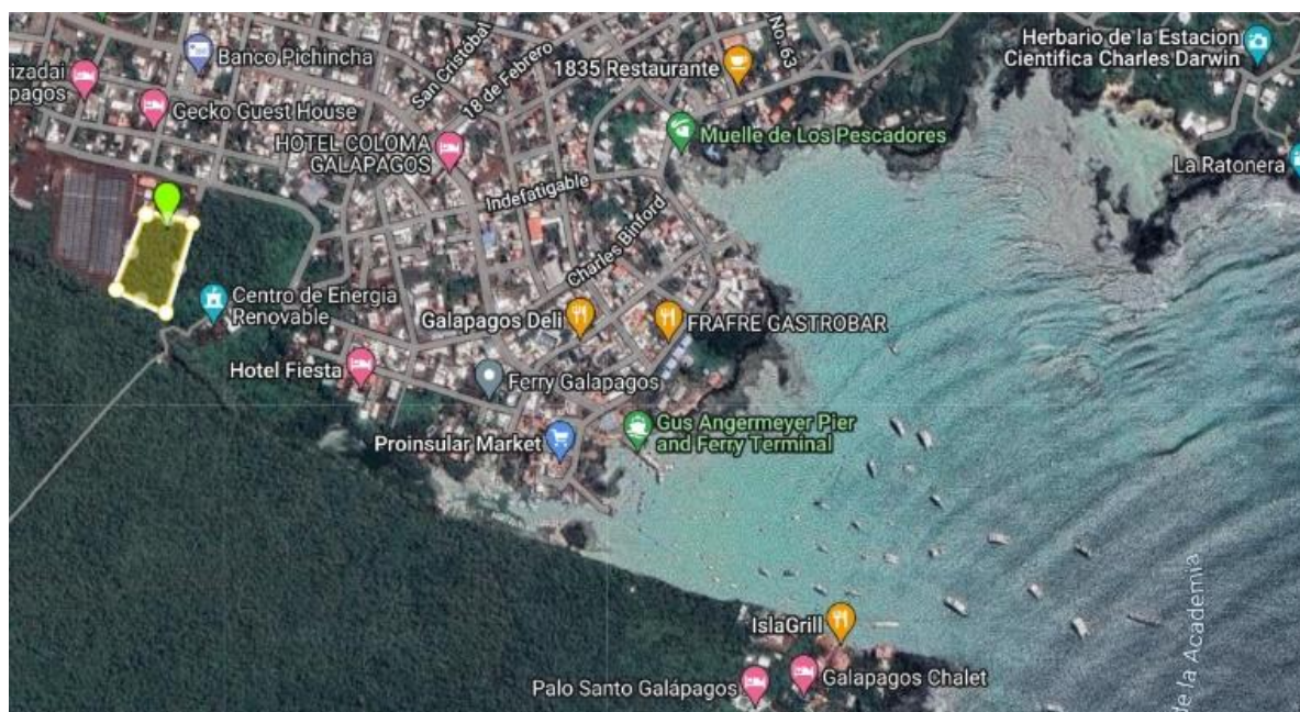
Gráfico 1 Mapa Ubicación – Google Maps