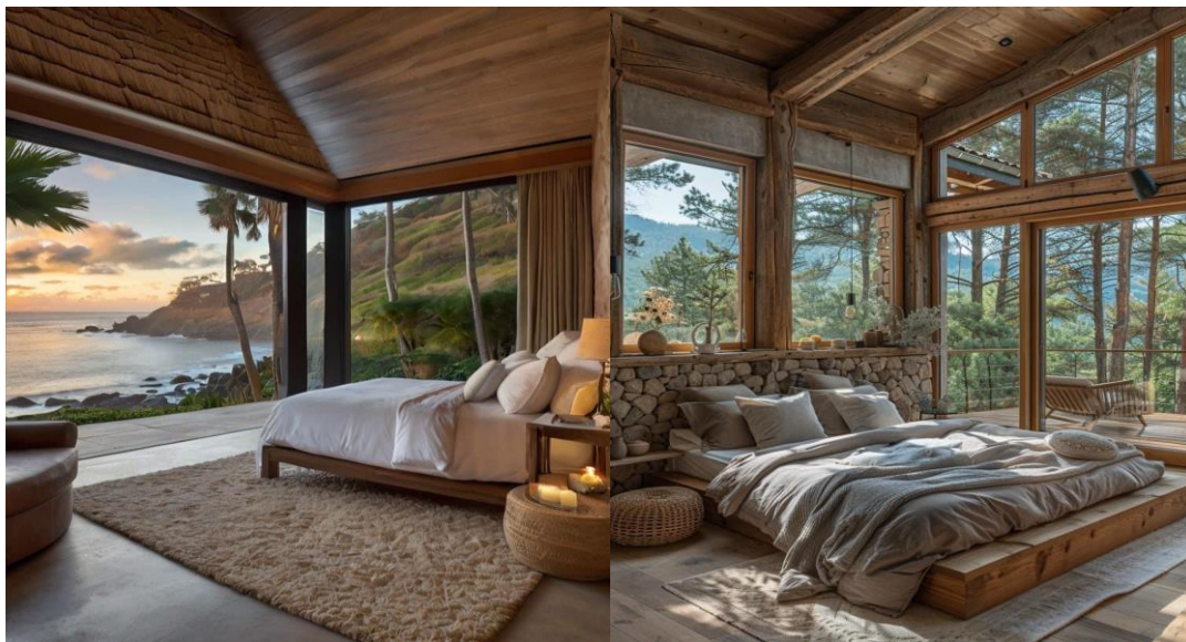
Gráfico 2 Diseño Habitaciones - IA

El hotel contará con 15 habitaciones construidas de manera sostenible, utilizando villas modulares que se adaptan al entorno de Galápagos. Las habitaciones estarán diseñadas en un