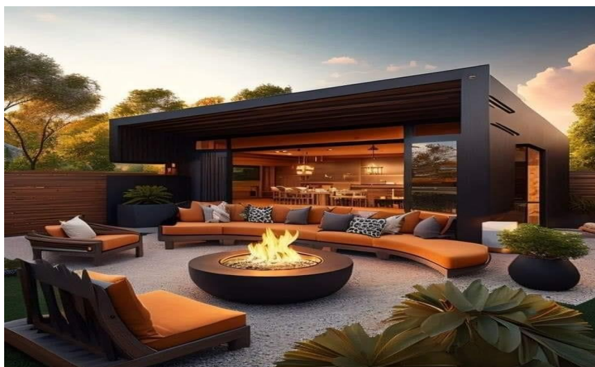
Gráfico 5 Restaurante “Galapagos fusion” – IA