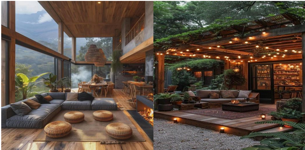
Gráfico 3 Hotel “Galapagos Refuge – MGallery”- IA

El hotel boutique de lujo “Galapagos Refuge – MGallery” en Santa Cruz, Galápagos, contará con 15 habitaciones sostenibles distribuidas en un máximo de cuatro pisos. Diseñado con un enfoque en la sostenibilidad, el hotel utilizará energía renovable, tecnologías verdes y prácticas de construcción ecológica, incluyendo sistemas de reciclaje de agua y paneles solares. Ofrecerá una experiencia de eco-lujo con servicios de primera clase y experiencias personalizadas, incluyendo un restaurante gourmet y un bar sostenible. Además, atraerá a viajeros corporativos con instalaciones adecuadas para eventos.