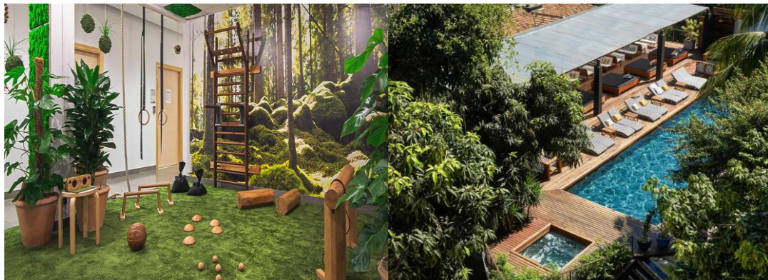
Gráfico 4 Gimnasio Sostenible – Piscina – IA & HSTMG