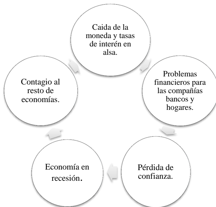
Figura 2. Círculo vicioso conductor de la crisis financiera.

El círculo vicioso de estas crisis se representa en la siguiente figura: