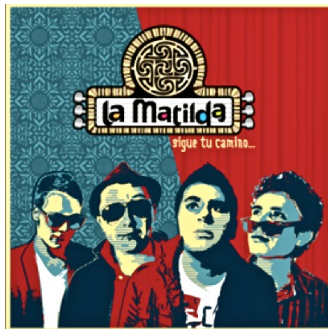
Figura 6. Portada de “Sigue tu Camino”

Las gráficas del segundo sencillo promocional de La Matilda se basan en un diseño propuesto por Mauricio Navas y Gustavo Castellanos. Los colores escogidos se deben al mensaje de protesta que tiene la canción seleccionada, además el fondo con textura propone una imagen elegante. Adicionalmente, el diseño tiene las ilustraciones de una foto de cada uno de los miembros de la agrupación y su logo representativo. A continuación se muestra en detalle los resultados obtenidos, después de algunas reuniones de modificación: