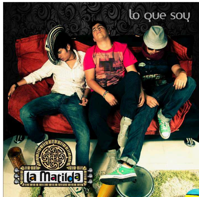
Figura 7. Portada de “Lo que Soy”

Por último, para la entrega del proyecto final de titulación en donde constarán los tres temas de La Matilda, se utilizó la misma portada del primer sencillo “Lo que soy”. Se conservó el nombre, ya que en definitiva es todo lo que la vida musical del productor representa.