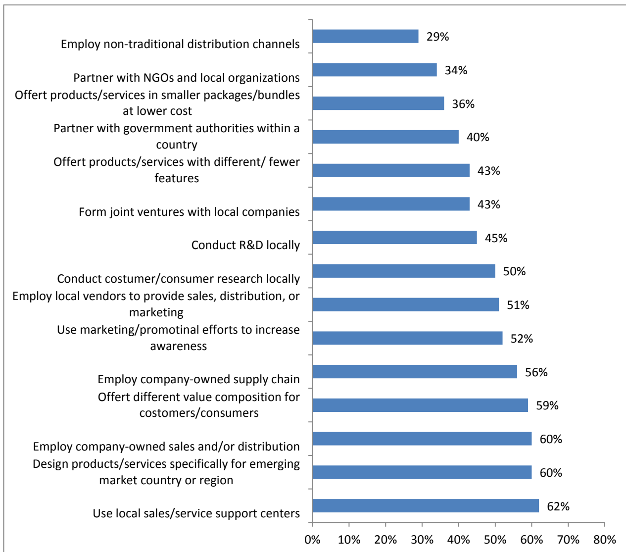
Ilustración 2: Éxito de las estrategias de crecimiento en mercados emergentes