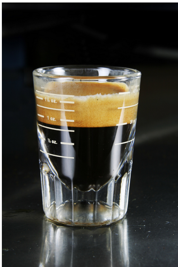
SHOT DE ESPRESSO DE UNA ONZA.