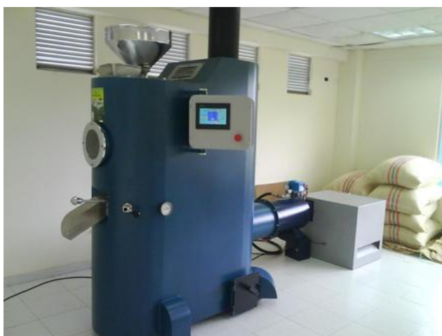
TOSTADORA DE CAFÉ.