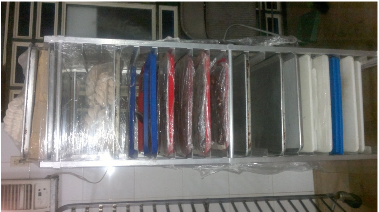
Coche aluminio para bandejas.