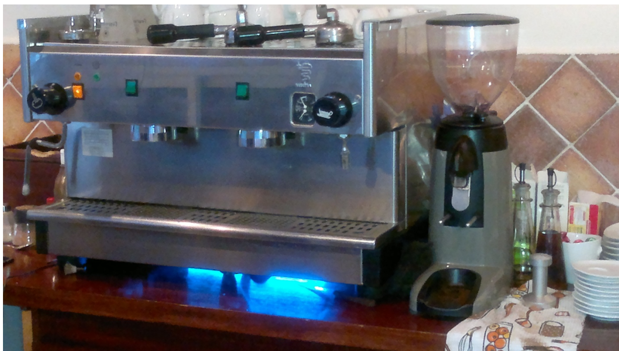
Maquina de espresso y molino de café.