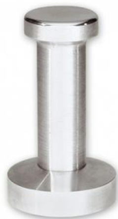
TAMPER PARA PORTA FILTRO.