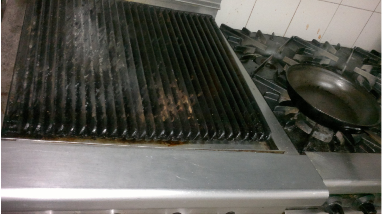
Grill, Quemadores y sartén.