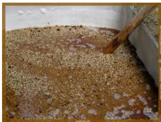
PISCINA DE INMERSIÓN