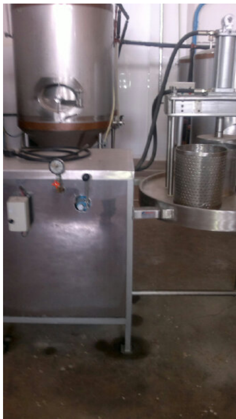
Prensa de extracción de aceite.