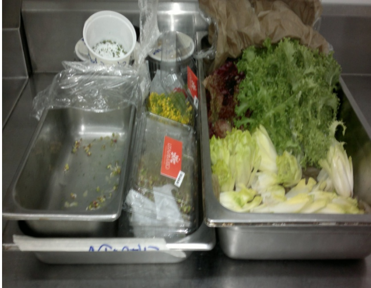
Bandejas de acero inoxidable.