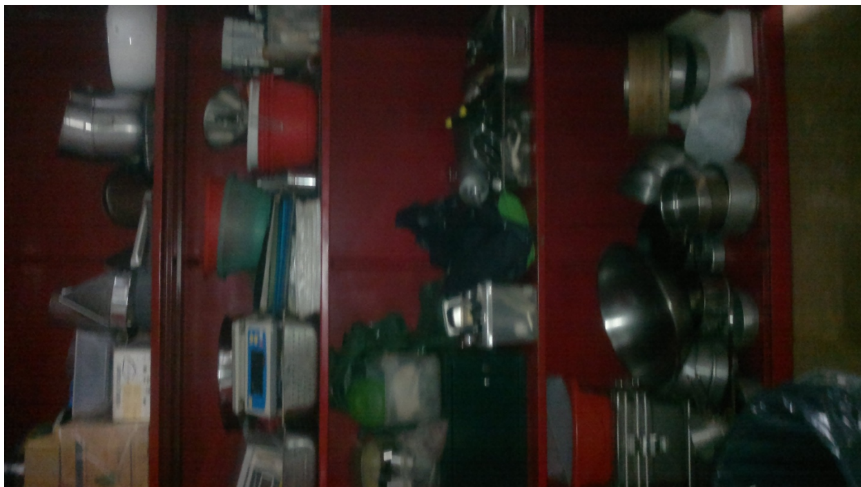
Bols, balanza, colador, ollas, etc.