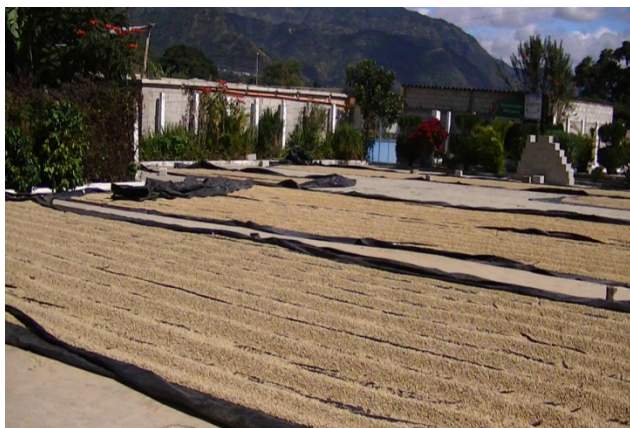
SECADO DEL GRANO.