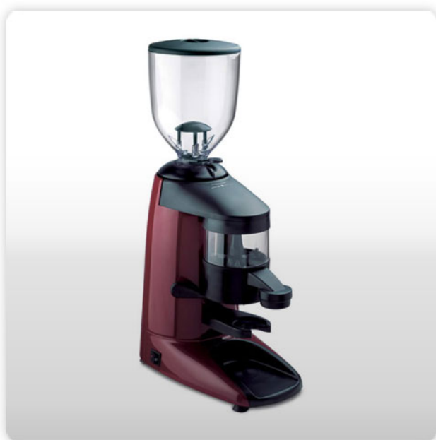
MOLINO DE CAFÉ.