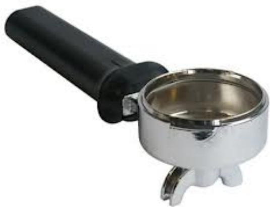
PORTA FILTRO MAQUINA DE ESPRESSO.