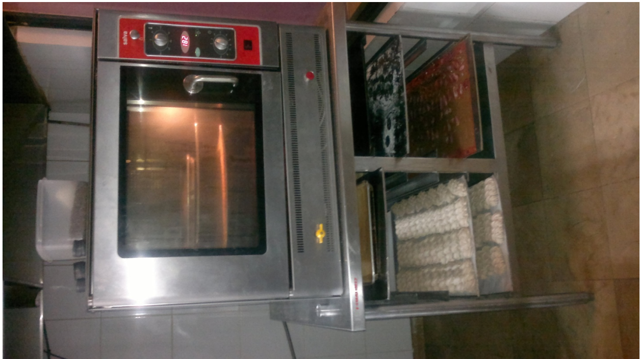
Horno de convección.