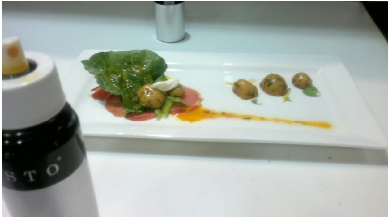
Atomizador para aceite.