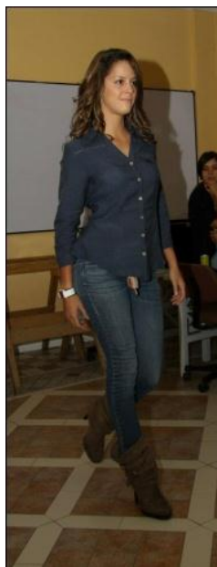
Fotografía no. 12

Al terminar con el dibujo y la selección de los diseños continuamos con el paso de escoger a las modelos para el desfile. Para esto tuvimos una reunión con la agencia de modelos DIS, la cual presento a sus modelos una a una en el campus de la universidad; nosotras debíamos juzgar su caminar en pasarela, su altura, su figura y su rostro. Al terminar con el casting se escogieron a las mejores y también a las que iban acorde a los diseños, luego de ya haberlas escogido se les designaba a cada una un diseñador con uno o varios trajes.