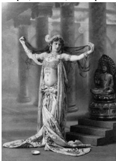
Fotografía no. 9

En los años previos a la primera guerra mundial y ya con una edad de 40 años se enamora de un capitán ruso llamado Vladimir de Masloff de 21 años, el cual fue enviado a una misión donde quedo mal herido y perdió un ojo. Ella decidida a ayudarlo acepta un trabajo para el ejército alemán como espía del ejército francés; la nombran espía H21, ella entregaba mucha información de la cual ninguna era cierta y concreta; uno de sus comunicados fue interceptado por los franceses en la cual se encontraba escrito su nombre como espía para los alemanes; fue arrestada de inmediatamente el 13 de febrero de 1917, fue encerrada en una celda y solo se le permitía ver a su abogado quien también fue uno de sus ex amantes. Ante sus interrogadores franceses dice en voz alta: “Una cortesana, lo admito. Un espía, nunca!”; "Siempre he vivido para el amor y el placer."