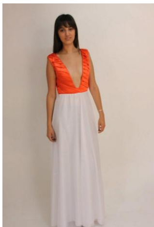
Fotografía no. 15

Al momento de confeccionar las prendas me tomo un poco más de tiempo ya que mis prendas debían tener forro, entonces debía hacer doble trabajo. Ya con las prendas confeccionadas pero no terminadas procedí a la prueba de vestuario con las modelos, en este paso se realice ajustes y arreglos para que la prenda quede bien acorde al cuerpo de la modelo.