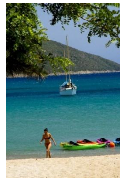
Fotografía no. 6

Le gustan los pintores John Singer Sargent y Camille Pizarro; le gustan los colores blanco almendra, salmón claro, rosa brumosa, etc. El cliente fue inspirado en una mujer con una vida muy ostentosa y con posibilidades de compra prendas de alto valor económico.