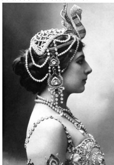
Fotografía no. 8

Con su danza y su atractivo físico indiscutible para esa época llego a ser una mujer muy cotizada en el medio, existían grandes filas de personas que esperaban afuera del teatro para poder llegar a verla.