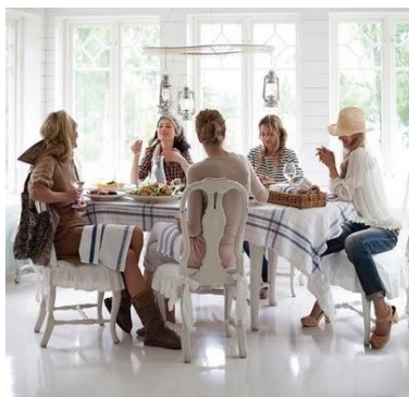
Fotografía no. 4

Le gustan las piedras preciosas, los chifones, sedas, encajes, transparencias, bordados y estampados; le gusta la tecnología y siempre se encuentra al tanto de los nuevos productos tecnológicos; le gustan los muebles con un estilo rococó moderno.