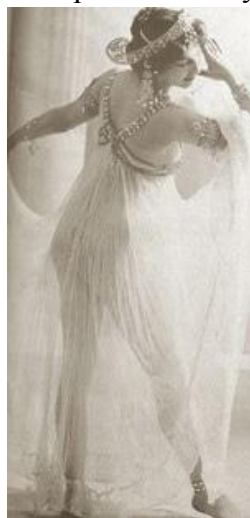
Fotografía no. 10