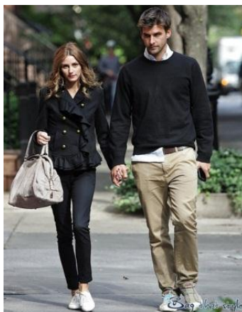
Fotografía no. 2