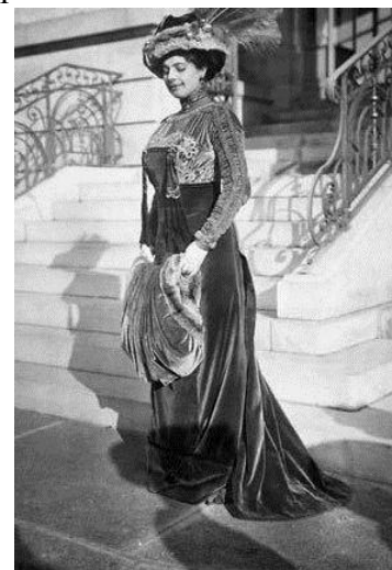
Fotografía no. 11

En su juicio todas las pruebas que tenían daban en contra a la inocencia de ella por este motivo fue sentenciada a muerte.