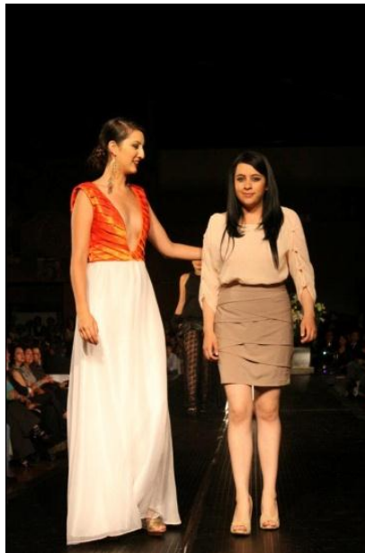
Fotografía no. 16

Las modelos regresan a backstage y vuelven a salir de la mano de la diseñadora, al volver a backstage pasan a caminar en pasarela solo las diseñadoras; al terminar con el desfile se termina con todo el gran proceso de realizar una colección y presentarla ante un público.