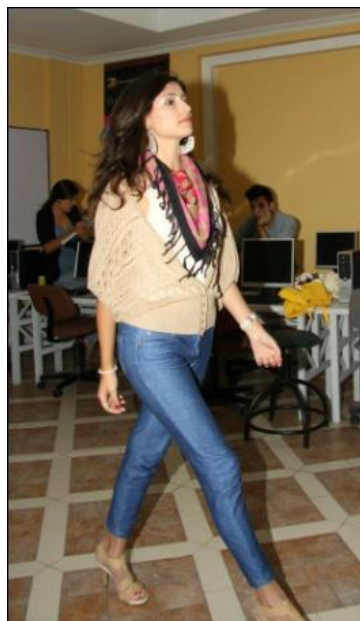
Fotografía no. 13