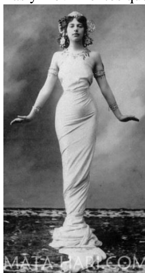
Fotografía no. 7

En el año 1905 la moda oriental se encontraba en auge en París, al llegar ahí decide crear un personaje ficticio llamado Mata Hari que en idioma javanés significaba ojo del amanecer, decide crear este personaje para ocultar su verdadera historia llena de sufrimiento y dolor. Con la creación del personaje empieza a crecer las mentiras sobre su vida, ella decía que venía de un palacio de la india lleno de lujo y ostentación donde le enseñaron todas las danzas y movimientos que lucía sobre el escenario.