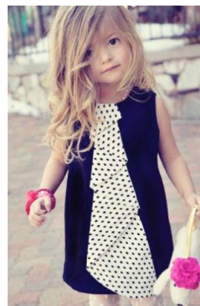
Fotografía no. 3