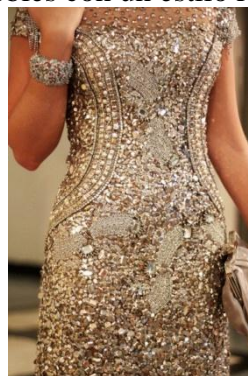
Fotografía no. 5