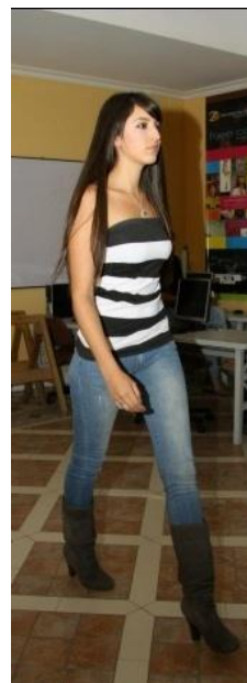
Fotografía no. 14

Ya escogidas y designadas las modelos se procede a tomar medidas de cada una dependiendo del diseño a realizarse, también al ya haber completado este paso se construye una ficha técnica con los datos y medidas de la modelo al igual que con el dibujo del diseño plano y sobre figurín.