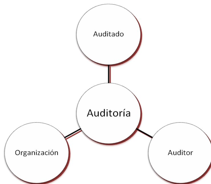
Figura 2: Involucrados en una auditoría

Las auditorías tienen que proporcionar información para la toma de decisiones, ya que van a ser una combinación de evaluaciones de cumplimiento y comportamiento. Se van a identificar tres elementos básicos que se encuentran relacionados entre sí, para que se pueda llevar a cabo la auditoría. 6