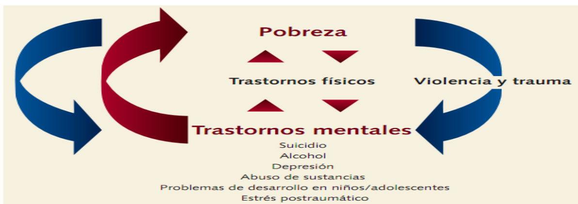
Figura 1.3 Pobreza y Trastornos Mentales.

La violencia y el abuso generan malestar general y pueden inducir trastornos mentales, sobre todo en los sectores más vulnerables. Dado que son inexistentes las inversiones adecuadas en salud mental, se puede observar un círculo vicioso entre pobreza y trastornos mentales, lo que estanca el desarrollo (OMS, 2004). La figura a continuación detalla dicho fenómeno.