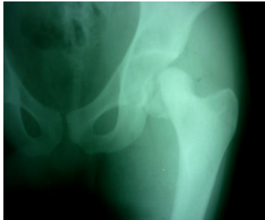
Imagen 1. Rx AP de cadera izquierda con Fractura de cabeza femoral