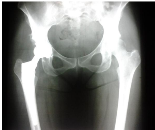
Fig 2: Artroplastia de cadera derecha post quirúrgico