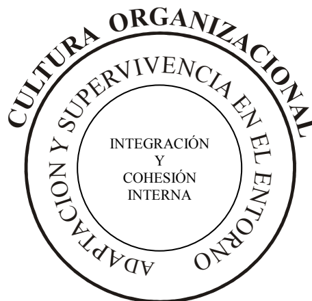
Gráfico No. 1 Cultura de la organización.

Elaborado por Flavio Espinosa a partir de las ideas de Schein (1988)