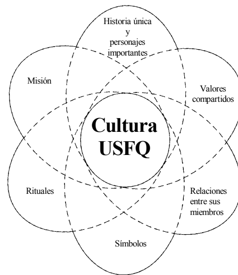
Grafico No. 3 Consolidación y transmisión de la cultura

Elaborado por Flavio Espinosa, adaptado de Owens (2004)