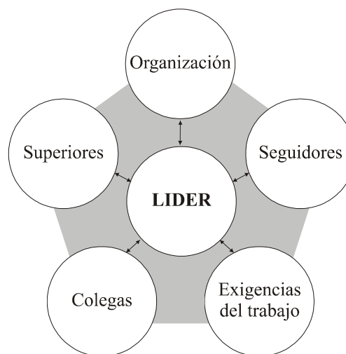
Gráfico No. 5 Relación del líder con los miembros de la organización en la formación del ambiente

Elaborado por Flavio Espinosa, adaptado de Hersey & Blanchard (1977)