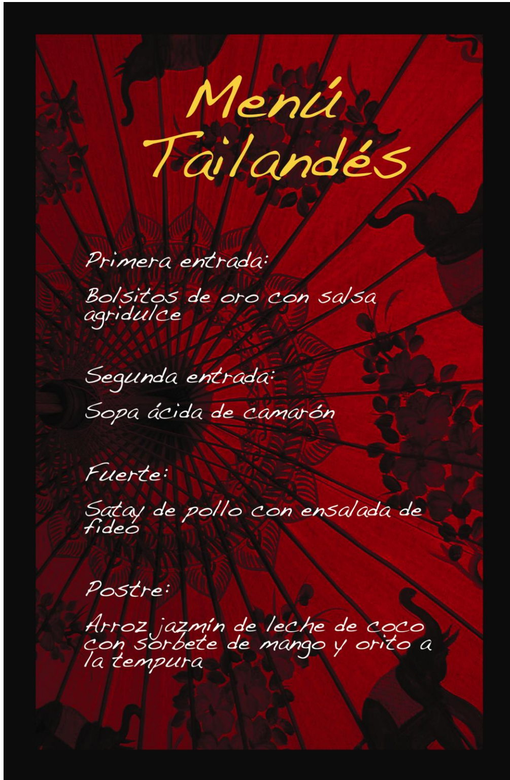
Arte del menú