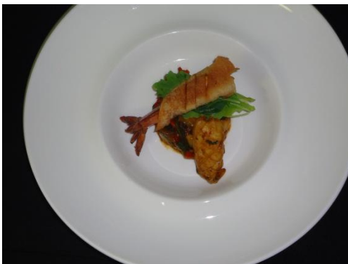
Wonton de langostino con salteado de calamar