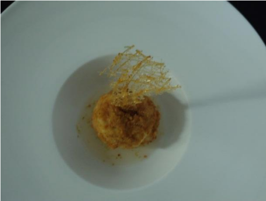
Helado frito de cerveza