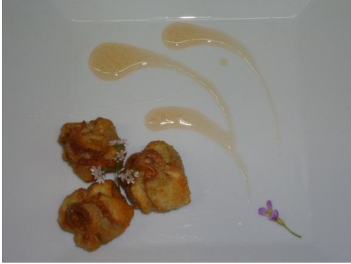
Segunda entrada (Sopa ácida de camarón)