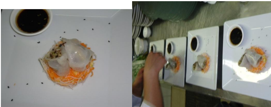
Enrollado de setas en papel de arroz

y la aprobación de la segunda entrada la cual era la sopa ácida de camarón. En la segunda degustación todos los platos fueron aprobados. Según el criterio del panel de degustación los platos no eran los más comunes de Tailandia sino los más rebuscados (a excepción de la sopa ácida de camarón), faltaban ingredientes típicos y representativos del país como: mango, maní, arroz jazmín y frutas tropicales. Finalmente en un menú tailandés siempre debían haber platos más populares del país como: Padtay, Satay, bolsitos de oro, etc., entre otros.