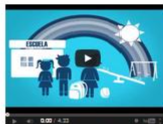
"Eradicación del Trabajo Infantil" producido por el Proyecto Red de Empresas por un Ecuador Libre de Trabajo Infantil.

HEMOS CREADO UNA SOCIEDAD EN LA QUE VECINOS TRABAJANDO ESTANDO COMO NORMAL Y ESTO ES CONSECUENCIA DE LA ALTA NECESIDAD QUE FAMILIAS EN SITUACIÓN DE POBREZA TIENEN POR LO QUE DEBEN HACER TRABAJAR A TODOS LOS MIEMBROS DE LA FAMILIA YA QUE APROXIMADAMENTE, LOS NIÑOS TRABAJADORES REPORTAN CON UN 10% DEL INGRESO FAMILIAR.