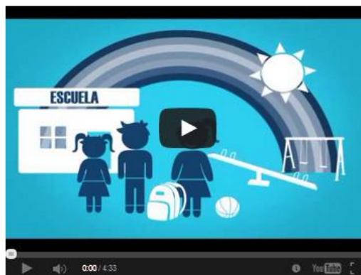
"SENSIBILIZACIÓN DEL TRABAJO INFANTIL" PRODUCIDO POR EL PROYECTO RED DE EMPRESAS POR UN ECUADOR LIBRE DE TRABAJO INFANTIL