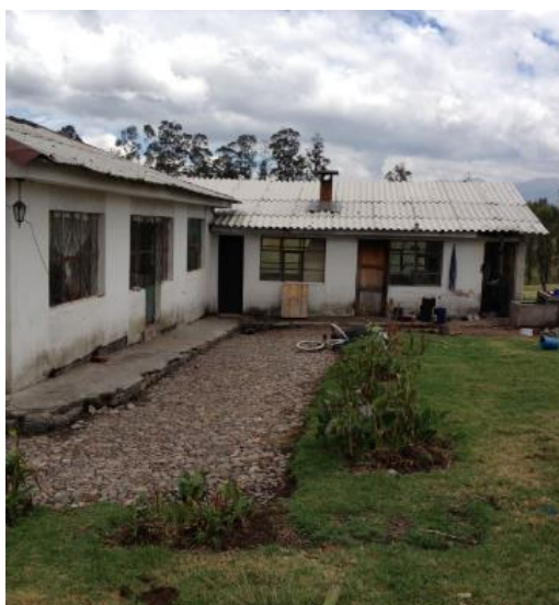
Fotografías 1.1: Viviendas Habitadas en el terreno de estudio