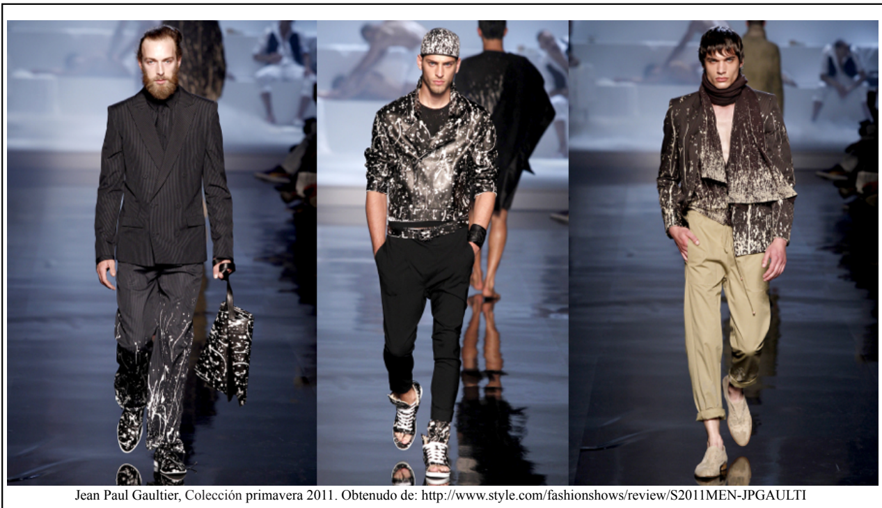
Jean Paul Gaultier, Colección primavera 2011. Obtenido de: http://www.style.com/fashionshows/review/S2011MEN-JPGAULTI

De la misma manera, ha habido varios diseñadores que también se han inspirado en las obras de Pollock, en este aspecto vale reconocer el trabajo de Jean Paul Gaultier para su colección masculina de primavera 2011. En esta colección Gaultier usó la técnica de Pollock pero se basó en dar ese efecto del “Action Painting” en las telas negras con los salpicones blancos. Esta colección se basó en una paleta de colores muy esquemática pues se ve el uso de negro como base, el blanco, el beige, morado y marrón y en telas se destacó el uso de cuero, telas livianas y translúcidas en su mayoría. Gaultier para esta colección se inspiró en motivos étnicos, en los volúmenes y en las texturas y por esta razón es que sobresalen las prendas que tienen el efecto Pollock en ellas. Estas prendas se ven bastante clásicas y Gaultier llevó esta técnica a otro nivel cuando ofrecía lentes 3D para que las personas pudieran apreciar el efecto que brindó y la vuelta que le dio a la forma en cómo se inspiró en la obra de Pollock.