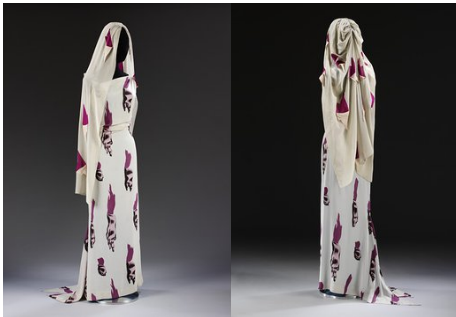
Schiaparelli & Dalí, Skeleton dress, 1938. Obtenido de: http://collections.vam.ac.uk/item/O65687/the-skeleton-dress-the-circus-evening-dress-elsa-schiaparelli/

la colección. El “Tear Illusion Dress” tiene un patrón muy distintivo y curioso, da la sensación de que es piel rasgada, incluso el velo que es parte también del vestido tiene pedazos de tela que simulan piel desgarrada. La combinación de colores en el vestido es bastante extraña, confunde las expectativas de quien ve esta prenda, y esta es la misma ilusión que Dalí quiere dar en su obra. (Pass, 2014) Así mismo, el “Skeleton Dress” es bastante literal, se quiere enseñar un esqueleto, tal como lo dice su nombre y las piezas que hacen esta prenda simulan y tienen el volumen que muestran como si fueran los propios huesos de una persona. Schiaparelli tomó los bocetos que Dalí había realizado de calaveras y los plasmó en sus prendas. Es así como Elsa Schiaparelli se ve influenciada por el arte de su época, la moda se ve claramente influenciada por las Ideas de la época, en especial del Surrealismo. Elsa encontró la forma de expresar el arte en la moda de una manera muy efímera y real, lo cual cautivó a muchas personas y actualmente influencio a diseñadores modernos que parece que van con esta línea de ideas acerca del manejo de las texturas, las formas y colores.