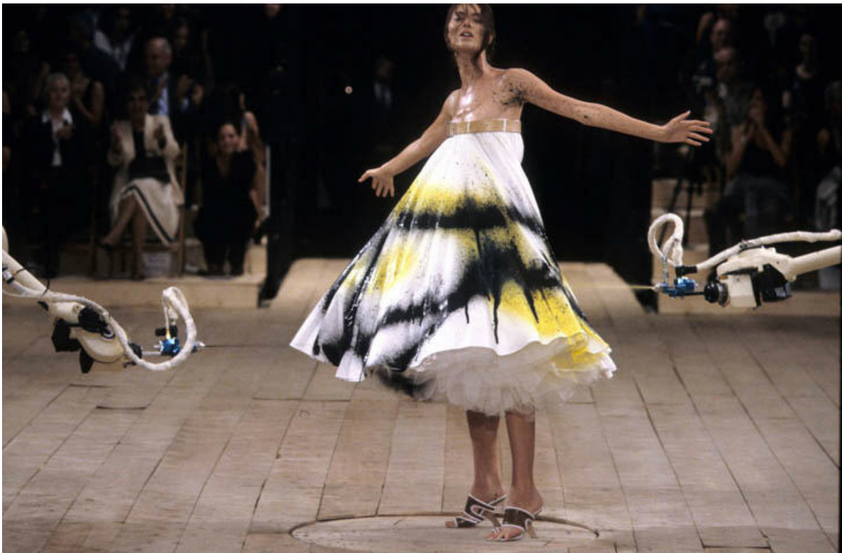
Alexander McQueen, Colección primavera/Verano 1999. Obtenido de: http://blog.metmuseum.org/alexandermcqueen/dress-no-13/

plataforma en movimiento, se ve esa interacción entre la pintura y la moda inspirada en dar esa emocionalidad del momento. Ese espacio inesperado que causo mucho impacto al público. Con esta técnica se puede hacer referente a expresión suelta, al momento espontaneo que juega la pintura en la obra de Pollock y el papel que estas manchas y líneas crean esa inspiración artística.