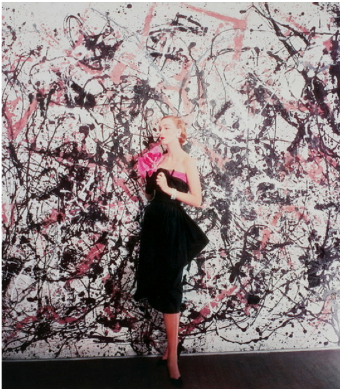
Cecil Beaton, The New Soft Look, 1951.

Así mismo, en un plano más contemporáneo Alexander McQueen se vio influenciado por el arte de Jackson Pollock en su colección de Primavera/Verano de 1999. En este desfile la propuesta fue muy diferente, el vestido que se expuso al final era un vestido blanco, como un lienzo listo para ser pintado. El momento en el que las dos máquinas que estaban instaladas empezaron a lanzar pintura y la modelo estaba en una