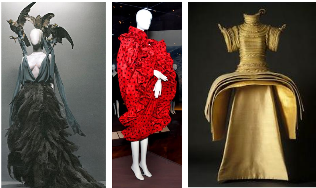
Savage Beauty de McQueen, Balenciaga and Spain y Art into Fashion de Capucci. Obtenido de: http://carriesdesignmusings.blogspot.com/2011/06/alexander-mcqueen-savage-beauty.html http://artandentertainme.blogspot.com/2011/04/balenciaga-and-spain-at-de-young-museum.html http://www.pinterest.com/fabuluscatwoman/capucci-robotto/

Otro ejemplo de moda creativa es aquella que debido al uso de materiales y a su estructura se aleja de ser utilitaria. Alexander McQueen era un diseñador que logró llevar sus ideas a un extremo creativo, rompió las barreras de lo convencional creando piezas que son consideradas obras de arte. Una de sus obras más controversiales fue el vestido de carne cruda que creó para una cantante. El vestido recibió más críticas negativas que positivas, sin embargo la creatividad del mismo nunca fue cuestionada. Diseñó también zapatos de taco cuya forma y estructura los convirtió en obra de arte pero nada utilitarios, el modelo era nada común, tan diferente que nadie esperaba ver zapatos así ya que no tenían ninguna semejanza con la idea preconcebida de zapatos altos. Estos zapatos conocidos ahora como “Armadillo shoes” fueron exhibidos durante su desfile para la última colección que el diseñador realizó llamada “Plato’s Atlantis” Primavera 2010 junto con muchas otras creaciones igual de creativas que en su mayoría reflejan el valor artístico del diseñador ya que ninguna prenda busca ser comercial, solo demostrar la innovación. Al igual que el vestido de carne, los zapatos de McQueen fueron utilizados por la cantante Lady Gaga quien es catalogada como extravagante. McQueen fue un artista que lograba impregnar toda su creatividad en sus diseños y por eso creaba piezas que ahora son