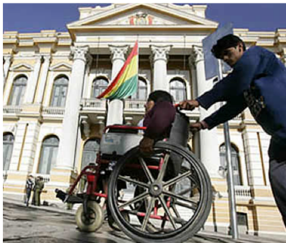
Ilustración 2 Ejemplo secuencias