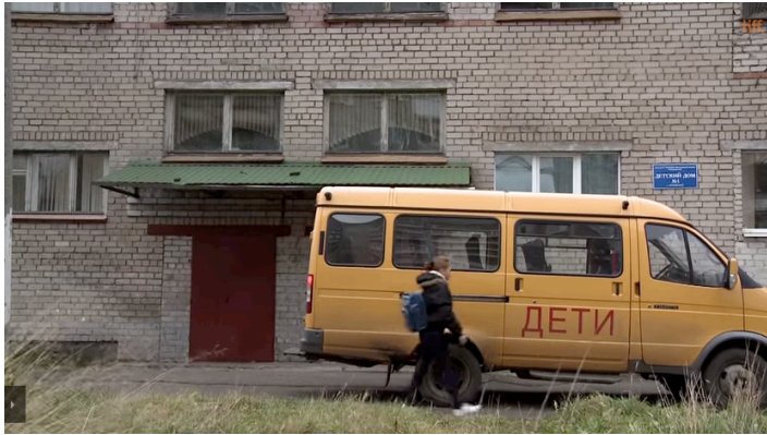
Ilustración - Referencia 2

Pero el frío, son tonos azules y verdes, un tanto contrastado y baja saturación.