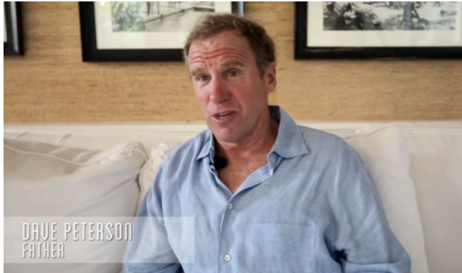
Ilustración - Referencia 1

En “Maratón de Vida”, en la sección de entrevistas se piensa manejar un todo cálido: es decir, el uso de amarillo y rojo.