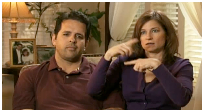
Ilustración 1 Ejemplo Testimonio

Secuencias: son tomas donde se ve al personaje principal realizando distintas actividades sean de rutina o de gusto personal.