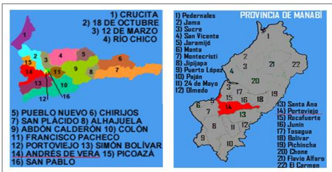
Gráfico 2. Mapa parroquial de la provincia de Manabí