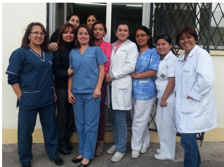
Gráfico No.3 Equipo de Atención

En el año presente esta unidad operativa incrementó de 8 talentos humanos en el año 2013, a 15 talentos humanos, conformados de la siguiente manera: 3 médicas generales, 3 licenciadas en enfermería, 1 obstetriz, 2 odontólogas, 1 Psicóloga itinerante -que acude 2 días por semana-, 1 asistente de estadística, 1 asistente de farmacia, 1 conserje, 1 vacunadora y 1 auxiliar de enfermería.