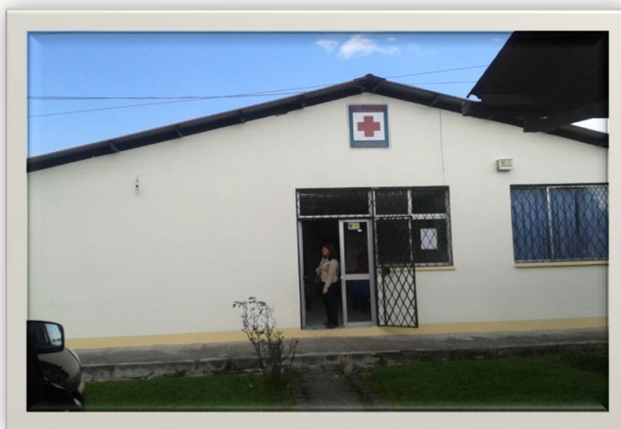
Grafico No.2 Centro de Salud de Tambillo