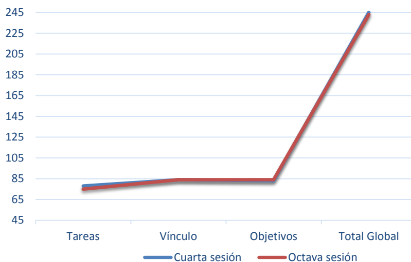
Figura 2. Variación de valores WAI