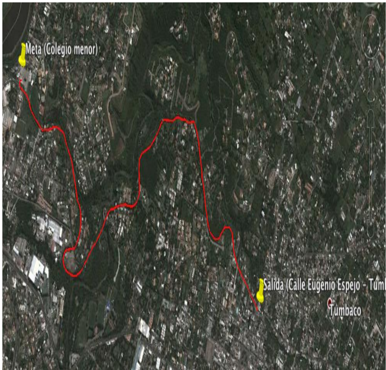
Ilustración 2 Recorrido Carrera 5k USFQ